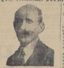
El grado de capitán d. Infantería, me hizo proposiciones para servir en el ejército de su patria, en calidad de instructor, proposiciones que yo acepté.