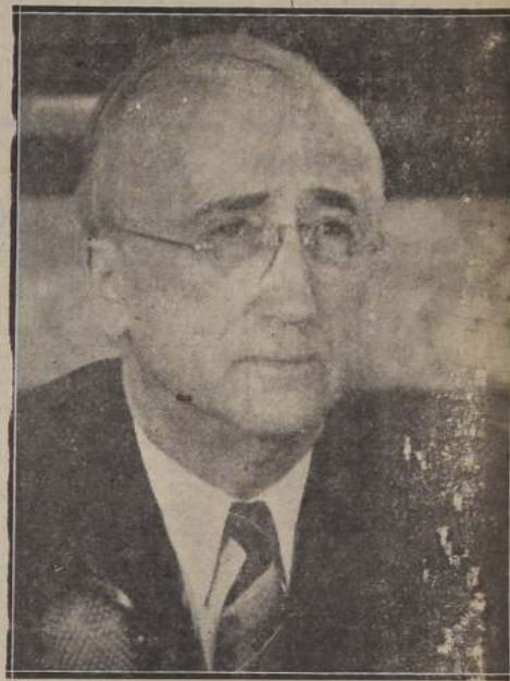
Mr. Byrnes informa por radio al pueblo americano, acerca de su gestión en la conferencia de Ministros de Relaciones, celebrada en París.

En un discurso pronunciado por radio examinó los acuerdos tomados en la conferencia recientemente celebrada en París por los Ministros de Relaciones de las cuatro potencias, y explicó el significado del alcance de la próxima Conferencia de Paz, en la cual participarán 51 naciones, y reveló que el representante militar de Estados Unidos en Alemania, el señor Byrnes, explicó que la administración de la zona norteamericana con cualquiera de las demás zonas de las potencias ocupantes, como una unidad económica. Los británicos expresaron su conformidad, pero al señor Byrnes ni Francia ni la Unión Soviética hicieron manifestación alguna. Añadió que se propone seguir adelante con este plan de "extrema coacción". El Secretario de Estado pronunció su discurso por radio poco después de haber acudido a informar personalmente al Presidente Truman del resultado de su misión. El señor Byrnes reiteró su advertencia que EE. UU. no quiere compartir responsabilidad alguna por la paralización económica y el estado de guerra y sufrimientos que se derivan de la situación presente de Alemania. Dijo que este país está siendo administrado en cuatro compartimientos, los aliados en vez de ser considerado como unidad organizada, según se prevé en el acuerdo de Potsdam. OPTIMISTA ACERCA DE LA PAZ A pesar del pesimismo de Byrnes (PASA A LA PAGINA 6)