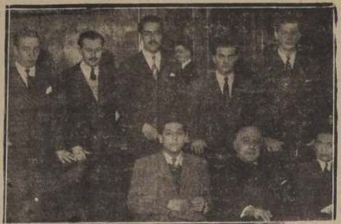
La delegación del Movimiento Democrático Juvenil Radical que ayer estuvo con S. E.

S. E. AGRADECIO LA ADHESION DE LA JUVENTUD DE SU PARTIDO