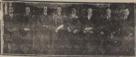
Autoridades que presidieron el acto del domingo de las Poblaciones Unidas del Sector Norte.

El Directorio Central de las Poblaciones Unidas del Sector Norte, llevó a efecto el domingo último una gran concentración en la Quinta Carreca con el objeto de exteriorizar los agradecimientos de este extenso Sector, por las obras de salubridad que se realizan a favor de más de 250.000 personas, al Vicepresidente de la República Excmo. Sr. Duhalde y Embajador de los Estados Unidos, señor Claude Bowers, al Instituto Cooperativo Interamericano y otras autoridades.