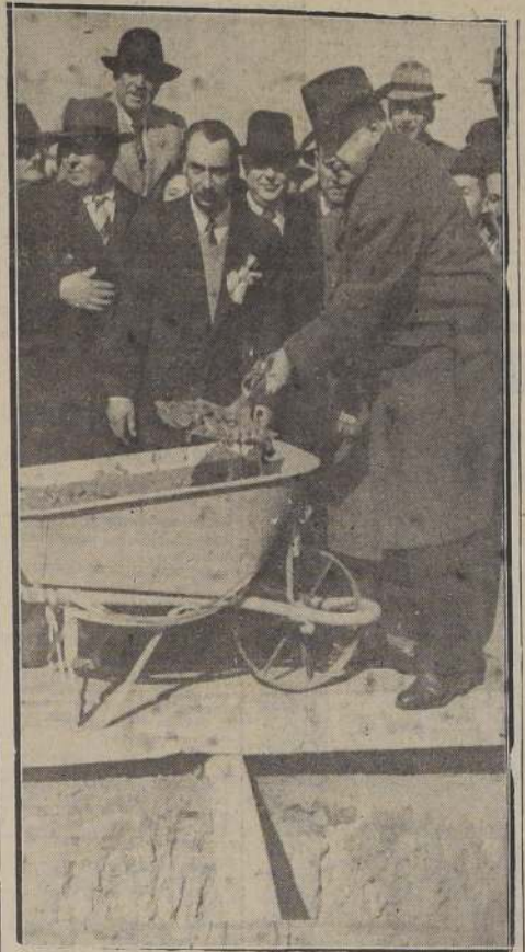
El Vicepresidente de la República, Excmo. señor Duhalde, coloca la primera palada de concreto en los cimientos de la futura Población "Presidente Ríos".