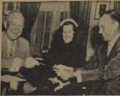
WASHINGTON.— El Presidente Dwight Eisenhower recibió, poco antes de partir a Denver donde pasará sus vacaciones, al famoso golfista Ben Hogan, acompañado de su esposa, con quienes departió amablemente sobre cuestiones deportivas.