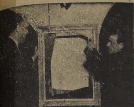
QUEDÓ EL CUADRO.— El ladrón dejó solamente el marco de la pintura, que fue uno de los orgullos de la Exposición Bial, presentada en la antigua casa Gath & Chaves. Dos altos funcionarios de la Policía Española, contemplaron y señalan la nerviosa línea que sigue la hoja de afilar del ladrón, para cortar el lienzo.

La composición del Consejo de la Caja de Previsión de la Defensa Nacional será, en lo sucesivo, la siguiente: los Comandantes en Jefe de cada Institución; el Subsecretario de Guerra; los Jefes del Departamento de Bienestar Social de cada institución; tres oficiales en retiro, uno de cada institución, de libre elección del Presidente de la República; tres suboficiales, uno de cada institución, designados por el Presidente de la República, y una asignataria de montepío.