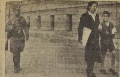
Una comisión de Mesa se dirige a depositar las actas de la elección a las oficinas del Conservador del Registro Electoral