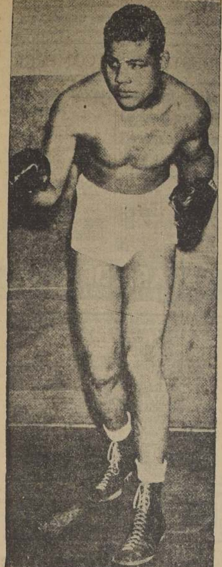
Joe Louis, el campeón mundial que jugará su título ante el alemán