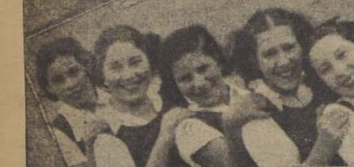
Paintball del General Baquedano, uno de los mejores de la capital, que aporta a la metropolitana el mayor contingente de efectivos.

La temporada de basketball femenino, contará en sus comienzos con buenos atractivos, realizándose en el mes de mayo cuatro lances, entre las selecciones de Santiago, Viña del Mar y Valparaíso, encuentros cuyas fechas ya ha fijado la dirigente máxima de este deporte.