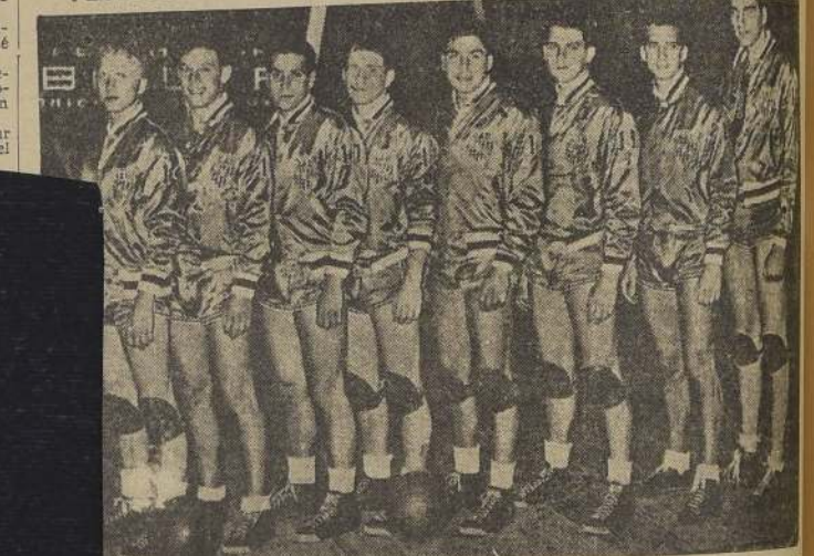
El equipo norteamericano de basketball, que ha cumplido una brillante campaña en Brasil, y cuya venida a nuestro país respalda la Federación de Basketball de Chile, para que el "quinto" de Estados Unidos actúe en Montevideo, Rosario y Mendoza, para fines del próximo mes, jugando el 25 y 26 en Santiago, y el 29 en Valparaíso.