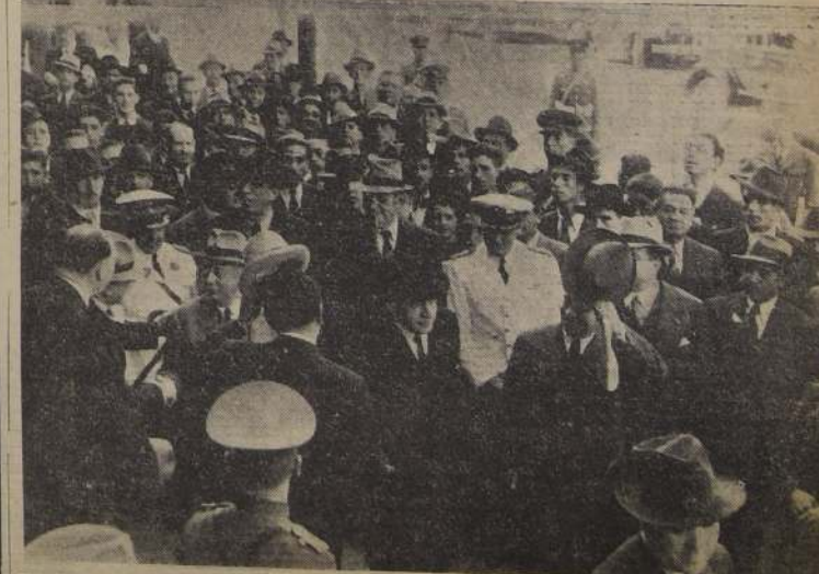
El público sigue a S. E. durante su regreso a la Moneda después de haber cumplido con sus deberes cívicos

Diariamente de 7 a 8 P. M. Secretaría: Bandera 70-A. Of. 4. Locales: INSTITUTO EDUCACION FISICA, INSTITUTO COMERCIAL FEMENINO, LICEO DE NINAS N.º 5. Matrícula abierta.