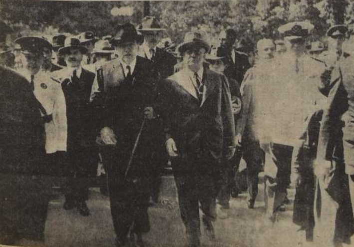
El Excmo. señor Alessandri acompañado del Ministro de Hacienda se dirige a la Municipalidad