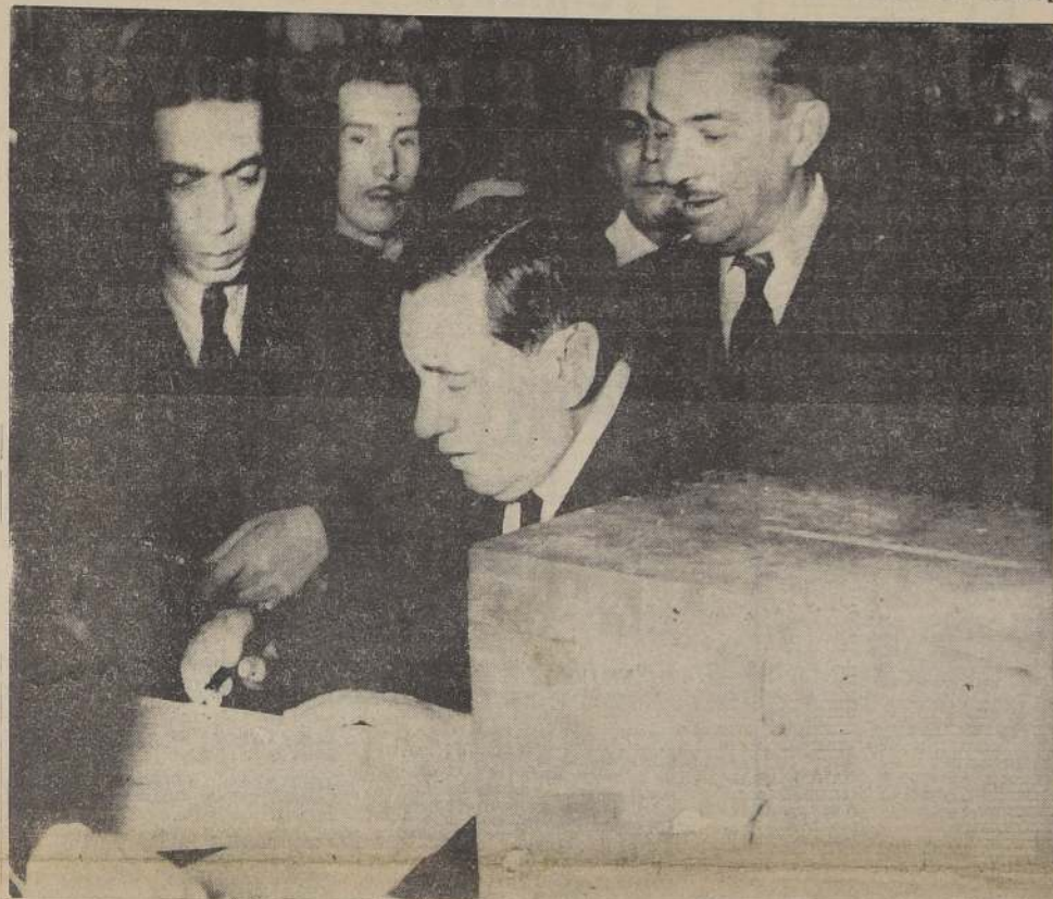
S. E. EN EL MOMENTO DE VOTAR

Detalles de los resultados de la capital y las comunas.— Informaciones enviadas por nuestros corresponsales en provincias