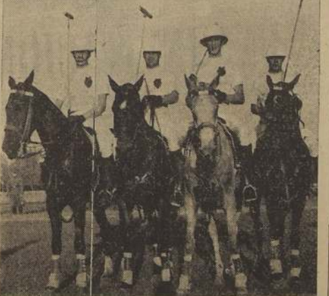
Equipo del Coraceros de Viña que venció por la diferencia mínima al Regimiento Cazadores