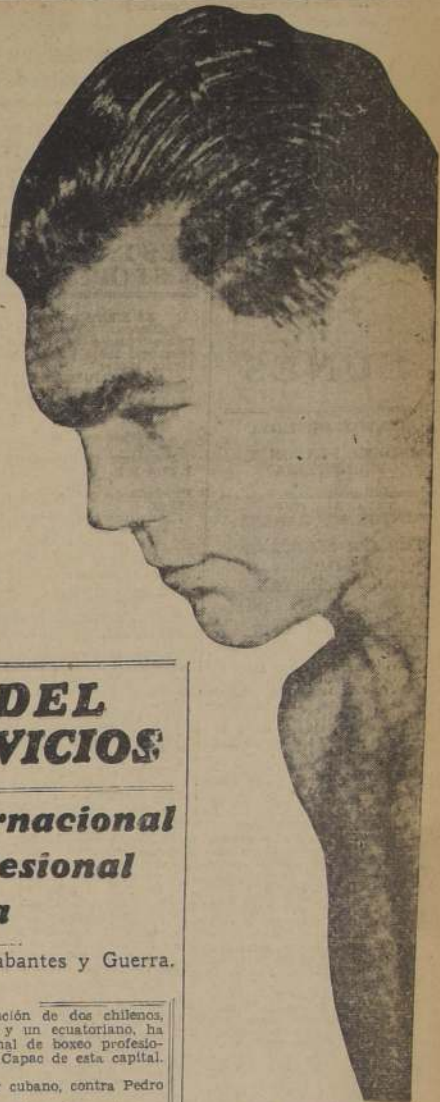
Max Schmelling, el rival de Louis

Louis colocó en el primer round ciertos golpes y uno de sus formidables hooks derechos, localizó la mandíbula de Thomas. Este cayó completamente inconsciente y el referee contó varios segundos. Thomas se incorporó y peleó groggy durante toda la noche. Así continuó desarrollándose el combate. Los rounds se sucedían y Thomas completamente en estado de inconsciencia y debili-