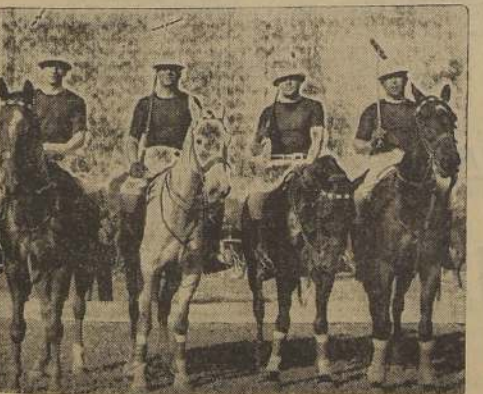
Equipo del Remonta que triunfó por 10 a 5 sobre la Escuela de Caballería