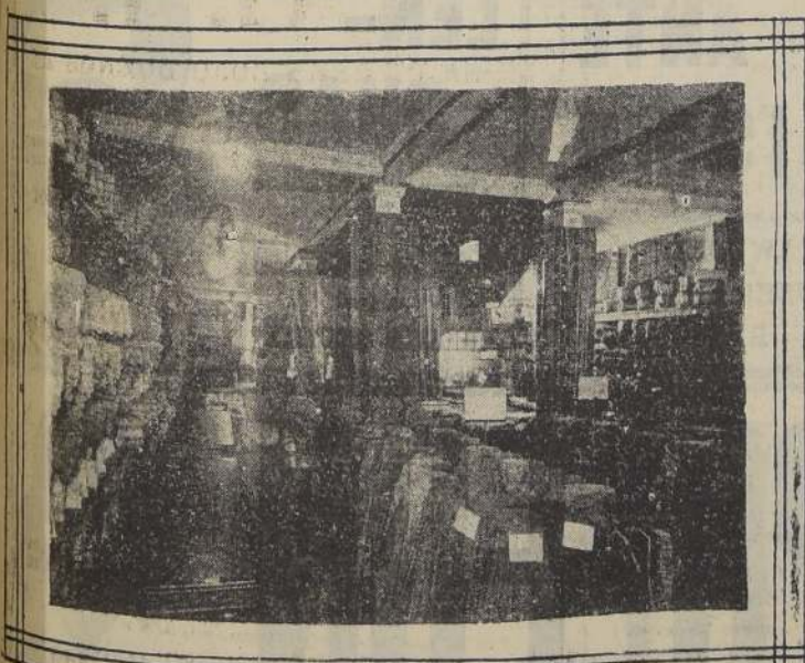
Sección de la gran sala de exposición y venta de muebles de sus almacenes de Delicias 1385

El desarrollo inusitado de las operaciones comerciales de la firma, obligó a ésta a instalar a principios del corriente año, una segunda casa de ventas, en un edificio cuyas transformaciones han importado cuantiosas sumas de dinero, y que es también propiedad de la firma.