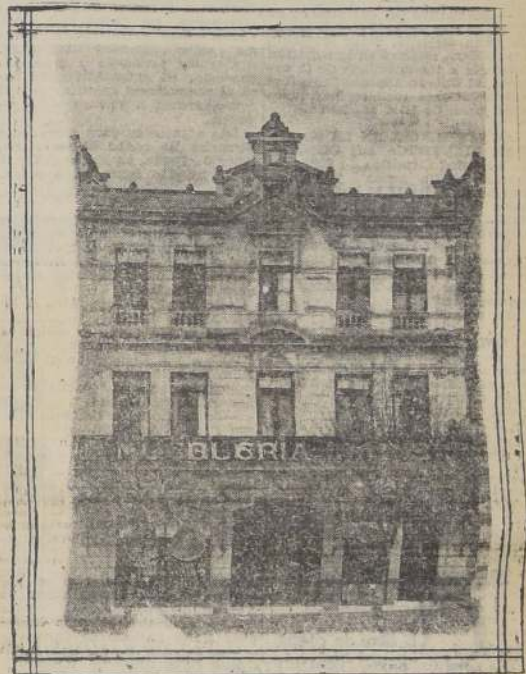
Departamento de muebles, recién inaugurado, en Delicias 1385, donde la "Mueblería París" presenta todos los modelos y productos de su gran fábrica. El público tendrá ocasión de apreciar los progresos de la industria mueblera del país y adquirirlos con una fuerte rebaja durante el mes de junio.

Una vez al año, en el corriente mes de junio, la Mueblería París efectúa sus ya tradicionales realizaciones, la última de las cuales se inicia hoy. Es ésta una costumbre de la firma que sus enormes existencias de mercaderías se ofrecen al público.