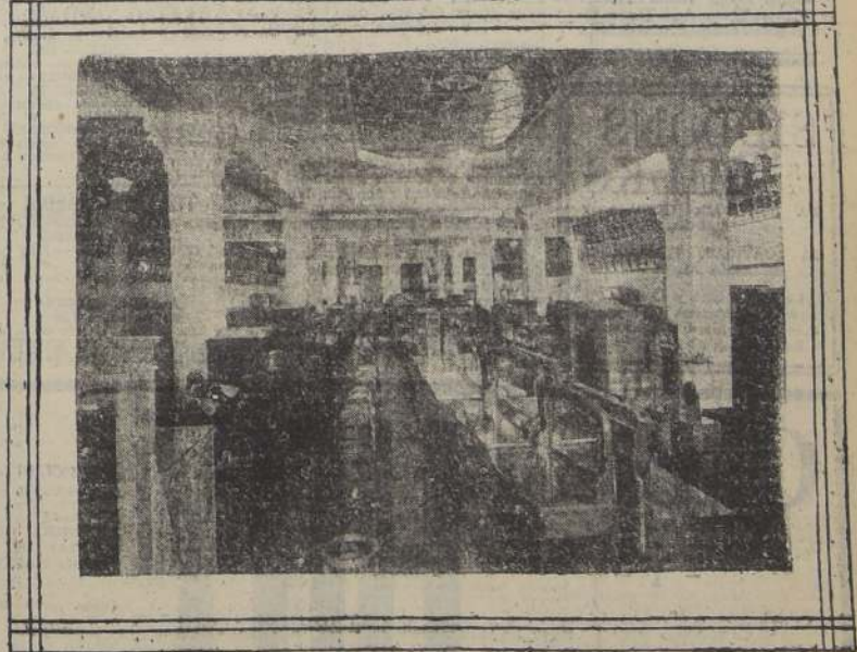
Una de las salas de ventas de tapicería y menajes de sus almacenes de Delicias 1141