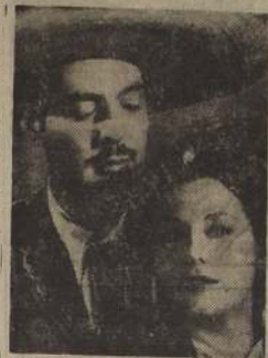
Una escena de "Las Mañanitas" que va hoy en el Santiago

En la película "Las Mañanitas", no se va a encontrar un tema estruendoso de sufrimientos y lágrimas. Por el contrario, tiene la misión de divertir. En su reparto figuran Esther Fernández, Antonio Badú, Carlos López Moctezuma, Carmen Molina y Agustín Isunza.