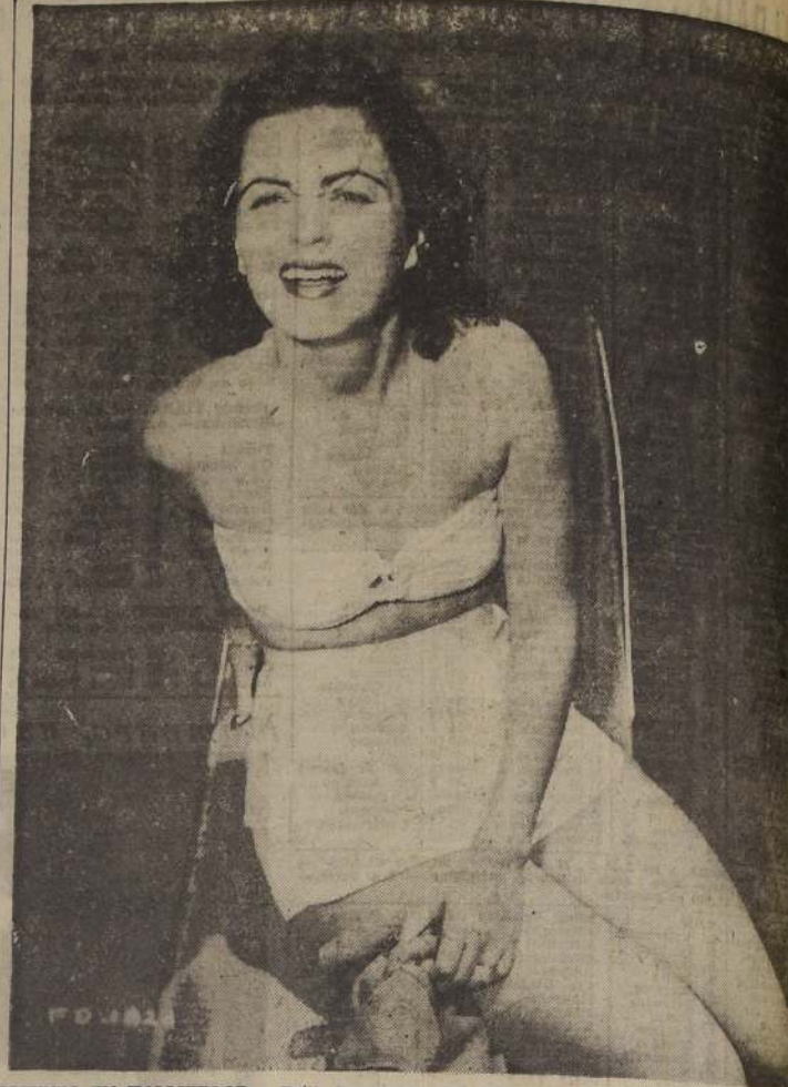
TRIUNFO EN HOLLYWOOD.—Faith Domergue, cuya belleza puede apreciarse en la foto, es una joven de la aristocracia francesa. Contratada por magnates del cine en Hollywood, ha tenido gran éxito en el papel protagonista de "La Rosa Blanca", cinta que se estrenará próximamente en Chile.

—Hago esa vida tranquila por que tengo que mantenerme en condiciones. No sé a ser que me caiga del trapeo! Bastaría