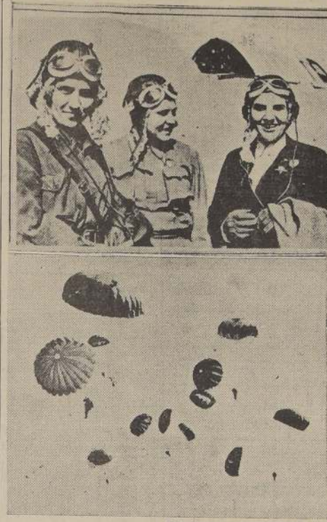
Aviadores, paracaidistas y guerrilleros de Rusia.

BERLIN, 20. (U. P.) — La batalla por Moscú sigue librándose con sostenido furor, según fuentes alemanas competentes, aumentando aún más la presión alemana sobre la capital soviética. No se han dado a conocer detalles acerca de la lucha desde el sábado, pero círculos alemanes expresan la esperanza de que pronto se logren importantes victorias. Los alemanes habían logrado finalmente completar el cerco de la capital. Esta noticia fue radiodifundida anoche, por la radio de París. Dicen, sin embargo, estas fuentes que las incursiones aéreas de las fuerzas alemanas contra Moscú han seguido aumentando fuertemente en seguridad y poder destructivo. Durante la noche, algunos de los ataques más recientes han sido casi tan poderosos como los peores que experimentó Londres durante la "batalla" del año pasado. La DNB informa que ayer los bombarderos alemanes efectuaron durante todo el día ataques contra las comunicaciones de tropas soviéticas, tanques y objetivos del tránsito. Dice la agencia informativa que el tiempo ha sido malo, pero que los aviones alemanes habían logrado destruir una cantidad de importantes vías férreas, arrastrando largas extensiones de líneas y dejando fuera de servicio locomotoras y trenes.