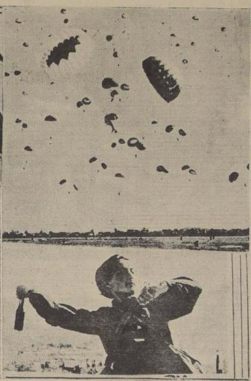
Aviadores, paracaidistas y guerrilleros de Rusia.

Ambos bandos han lanzado enormes fuerzas a la batalla. — Los rusos defenderán Moscú hasta el último extremo