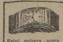
Reloj pulsera acero 15 Rubies, marca Certina. varios mo- delos $ 250.