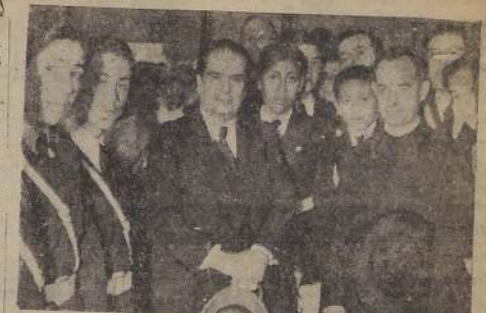
El Embajador de Bolivia y la delegación de estudiantes bo- livianos durante la inauguración de la Exposición de Arte Boliviano.

Exposición de Arte Boliviano Salón Oficial de Bellas Artes