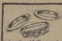
Argollas 18 K. y anillo oro 18 K. Bri- llantes de $ 1.050 a $ 3.500.—

Por compras superiores a $ 1.000 obsequiaremos una LINDA Muñeca ojos móviles de 50 cms.