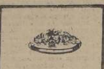
Anillos Cromo, P. blancas, gran recla- me $ 950