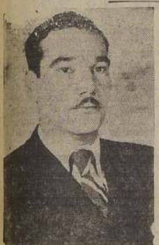
Cinco años. No resulta una frase simple.

SE HA ORGANIZADO EL BENEFICIO DE MAYOR ATRACCION Y DE MAYORES SIMPATIAS ENTRE TODOS LOS SECTORES DEL PUBLICO SANTIAGUINO.—REGALOS "ATKINSON", CINE Y LA NUEVA REVISTA DE ESTRENO, "LA BUEN HAMBRE NO HAY PAN DURO".—EL SABADO 23, DE BUTAN BETTY Y GLORIA, Y LOS FOLKORISTAS ARGENTINOS, "LOS TROPEROS DEL ALBA".