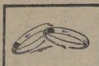
Argollas oro 18 K. garantizado, graba- das y selladas $ 230.