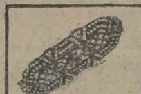
Broches fantasía Cro- mo. P. blancas $ 25.—