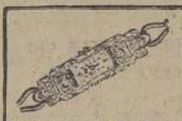
Reloj Oro 18 K. Pla- tino. Diamantitos- zafiros. Ancla 15 Ru- bies $ 550.—