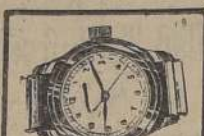
Reloj Acero Secun- dario, marca Certina. $ 270.—