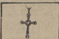
Cruz Oro y Platino. Brillantes, Diamantes y Zafiros, desde $ 550 a $ 5.500