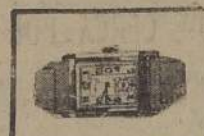
Reloj Cromo pulsera 15 Rubies para Niños a $ 150.—