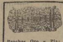
Broches Oro y Pla- tino. Brillantes y Dia- mantes desde $ 550 a $ 15.000