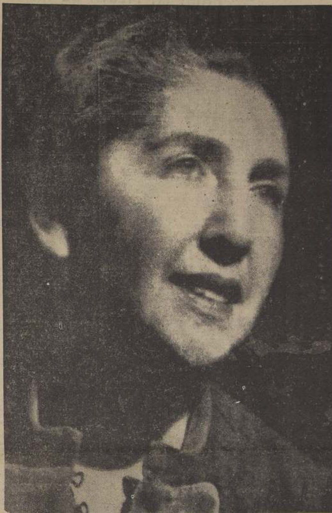
Señora Graciela Contreras de Schnake, Alcaldesa de Santiago

Decreto N.º 1577, de septiembre 8, por el que se establecen normas para el funcionamiento de las Ferias Libres, fué una de las preocupaciones preferentes de la Alcaldía. Este decreto, que no se desvirtúa el propósito que la Alcaldía tuvo en vista al establecerlas.