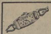
Reloj señora Cromo. 15 Rubies, lindos mo- delos $ 180.—