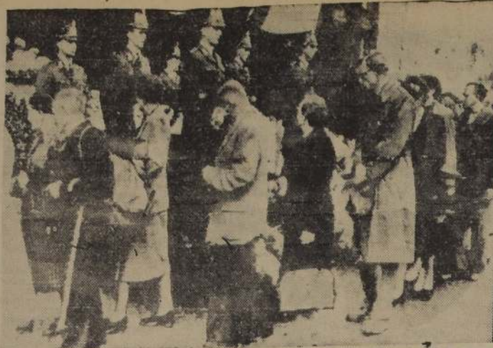
UN MILLON DE BERLINESES LLORAN POR REUTER.— BERLIN.— Una romería de acorridos berlineses, tanto de la zona Oriental como Occidental, pasa frente al ataúd que contiene los restos del ex Alcalde Ernest Reuter, en el edificio de la Municipalidad del sector occidental. Policía del sector monta guardia. Más de un millón de personas formaron parte de la romería en honor de Reuter, quien murió a los 64 años.