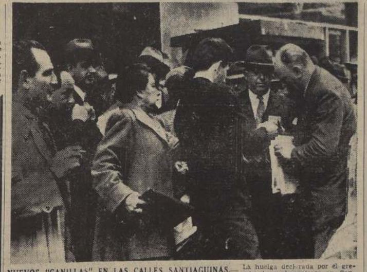
NUOVOS "CANILLAS" EN LAS CALLES SANTIAGUINAS. — La huelga decretada por el gremio de suplementeros en Santiago, Valparaíso y otras ciudades del país ha servido para que el público lector conozca a una clase de esforzados y valientes personajes que han arrojado el peligro de amenazas y ataques de los canillitas, para ofrecerle el diario del día con la noticia fresca y vibrante. Obreros y estudiantes, empleados y periodistas, han salido a la calle resguardados por la policía y boco a poco se ha ido normalizando la situación creada por el movimiento declarado por el gremio de suplementeros. La foto muestra una típica escena callejera de las muchas que ayer se presenciaron en Santiago.

En la Maternidad del Hospital Salvador, en los momentos del "apagón", cinco parturientas estaban dando a luz. Grande fue la aflicción del personal asistente al ver en completa oscuridad las salas. En tan difíciles trances rápidamente corrieron a buscar velas y lámparas, continuando en su ayuda de aliviar a las pacientes, que trajeron al mundo cinco hermosas y robustas criaturas.