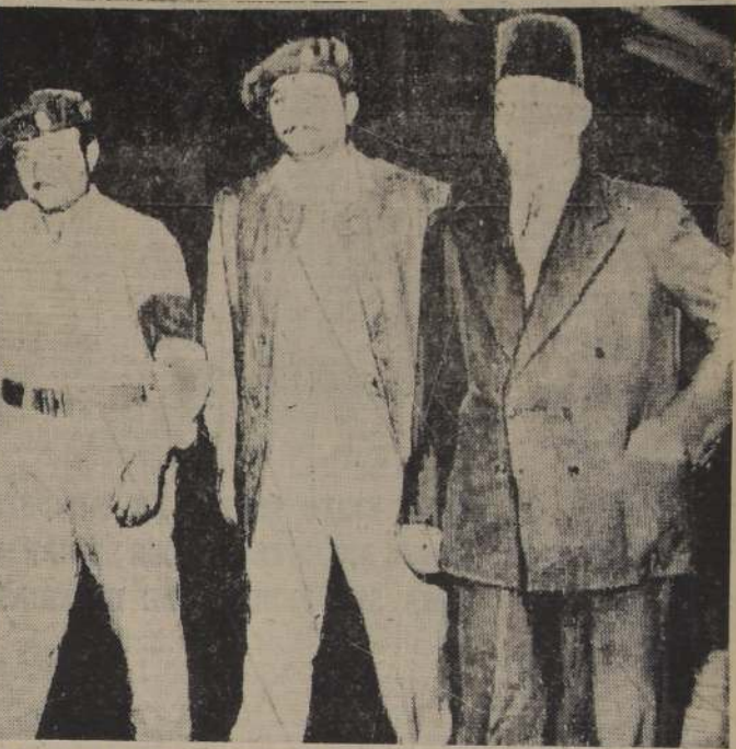
EX PREMIER EGIPCIO CONDENADO A MUERTE. — EL CAIRO. — El ex Premier Ibrahim Abdel Hadi (a la derecha) es escoltado por dos guardias al salir del Tribunal donde se ha sustanciado su proceso. Abdel Hadi —jefe del Partido Saadista que fue disuelto después de la expulsión del ex rey Farouk— fue sentenciado a muerte, acusado de traición. —.