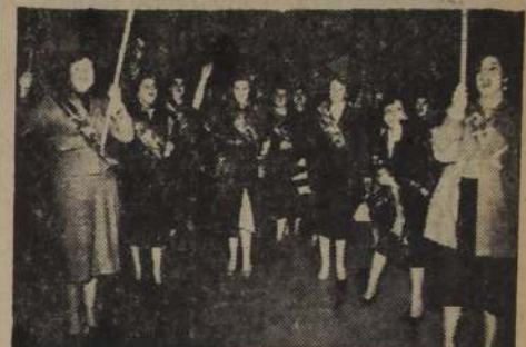
La mujer Ibañista también derrochó entusiasmo en el desfile con antorchas, estandartes y mojes que anoche puso al resaca en el corazón de Santiago. Estos son los efectivos del Departamento Nacional Femenino del Partido Agrario Laborista.