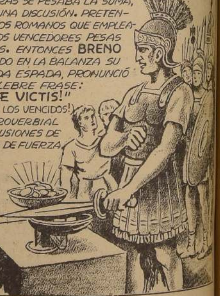
FIGURAS CELEBRES Y HECHOS FAMOSOS POR WALT MILLAR

"¡AY DE LOS VENCIDOS!" BRENO, NOMBRE QUE SIGNIFICA EFE. FUE DADO POR LOS ROMANOS AL JEFE GALO QUE SE ARROJÓ DE ROMA EN 390 ANTES DE J.C. — LOS DEFENSORES ROMANOS RESISTIERON EL ASIEDO DE LOS GALOS DURANTE SIETE MESES, ENTREGADOS A TODOS LOS HORRORES DEL HAMBRE Y POR ÚLTIMO PIDIERON LA CAPITULACIÓN, LA QUE CONSENTIO BRENO, MEDIANTE LA ENTREGA DE MIL LIBRAS DE ORO. MIENTRAS SE PESABA LA SUMA, HUBO UNA DISCUSIÓN. PRETENDIAN LOS ROMANOS QUE EMPLEABAN LOS VENCIDOS PESAS FALSAS. ENTONCES BRENO ECHANDO EN LA BALANZA SU PESADA ESPADA, PRONUNCIÓ LA CÉLEBRE FRASE: "¡VE VICTIS!" (¡AY DE LOS VENCIDOS!) HOY PROVERBIAL EN ALUSIONES DE ABUSO DE FUERZA