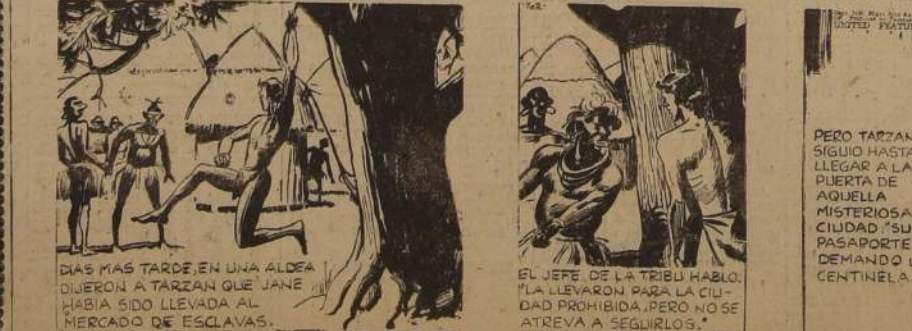
DIAS MAS TARDE, EN UNA ALDEA DIJERON A TARZAN QUE JANE HABIA SIDO LLEVADA AL MERCADO DE ESCLAVOS. EL JEFE DE LA TRIBU HABLO: "LA LLEVARAN PARA LA CIUDAD PROHIBIDA, PERO NO SE ATREVA A SEGUIRLOS."