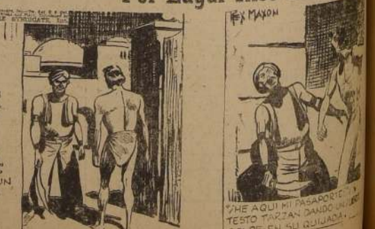
PERO TARZAN SIGUIÓ HASTA LLEGAR A LA PUERTA DE AQUELLA MISTERIOSA CIUDAD. SU PASAPORTE, DEMANDO UN CENTINELA.