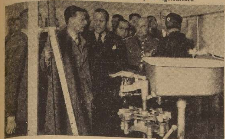
Los Ministros de Salubridad y de Agricultura, visitando una de las secciones de la Planta Pasteurizadora que se inauguró ayer en Rancagua.

Asistieron los Ministros de Salubridad y de Agricultura