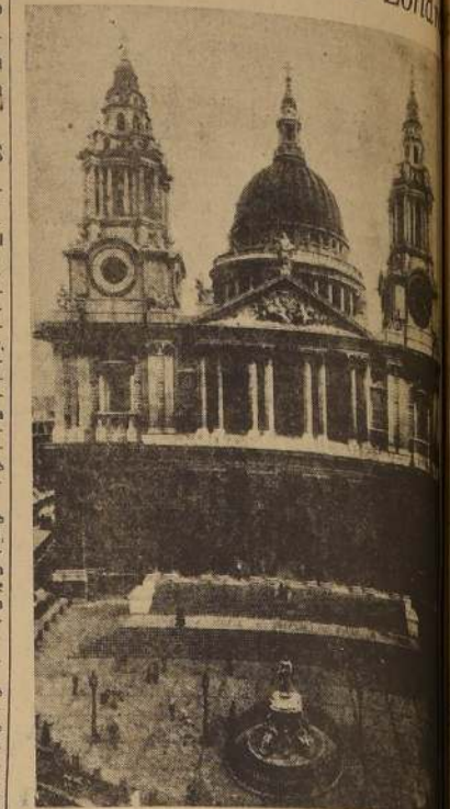
Vista de la Catedral de San Pablo, de Londres, que ha sufrido una gran explosión.

La Iglesia City Temple fue destruida completamente por