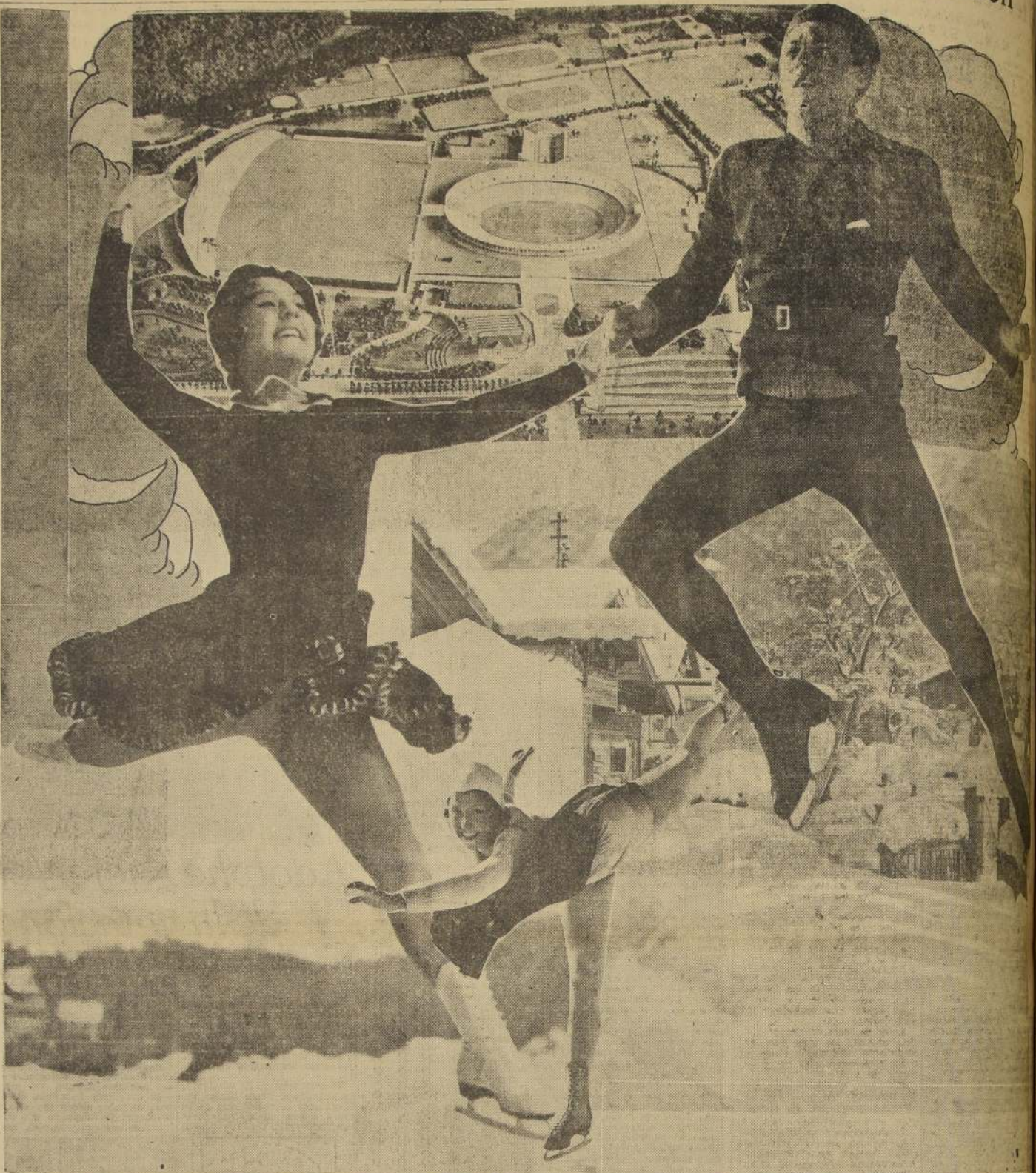
El grabado nos muestra a los campeones mundiales de patinaje, la notable deportista Sonja Henie, de Noruega, que aparece en dos actitudes, y el austriaco Karl Schuster. Al fondo, arriba, se destaca una vista del sector de Berlín en que se ha ubicado el Gran Estadio Olímpico, consus canchas anexas que servirá de escenario a la jornada que se inicia el 1.º de agosto próximo. Abajo una hermosa vista del magnífico campo de Garmisch-Partenkirchen, en el que se han desarrollado los Juegos de Invierno que finalizaron ayer.

Los juegos que, con una antelación considerable que dista su entusiasmo de trabajar intensamente en la construcción de la aldea olímpica. Las obras ya se están efectuando en los terrenos que los proyectos de los arquitectos Yrjö Lindgren y Toivo Jämsen. No se escatiman esfuerzos ni gastos para crear instalaciones dignas de los juegos. Ya se han removido 25,000 metros cúbicos de roca mediante el empleo de 1500 kilogramos de dinamita. Se obra de acuerdo a los deseos de los tres cuartas partes de las oraciones necesarias. En 1937 quedará terminada la labor.