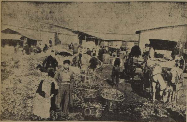
Condiciones inhumanas en que trabajan algunos vendedores de la Feria Municipal

Una medida del Comisariato que dió resultados contraproducentes. — Ahora hay una cantidad de gente que vende sus productos en el suelo. — Atentado contra la salud pública. — Otros aspectos del grave problema