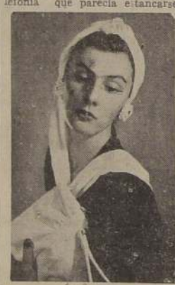
después de la presencia de esa otra cantante, que es prestigio nuestro y que se llama Malú Gatica.

A todo ello se agrega su estilo personalísimo. Hay escuela en su calidad musical. Sus éxitos alcanzados desde su primer paso son el producto de sus condiciones naturales y de sus largos estudios. Ha educado su voz, aprovechando sus condiciones intrínsecas.