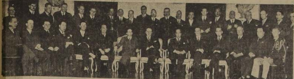
Asistentes a la manifestación ofrecida al señor Rodolfo Michel

Asistieron a la manifestación los Ministros de Hacienda y Relaciones Exteriores, el Embajador de Estados Unidos y otras altas personalidades