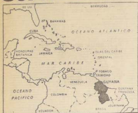
Posición de Guayana en América.

La actual Guayana, es la antigua colonia británica, que obtuvo su independencia el día 26 de mayo de este año. Su población es de 640.000 habitantes, para una extensión de 215.000 kilómetros cuadrados, casi igual a la de la Gran Bretaña, que en esa superficie tiene unos cincuenta millones de habitantes. Tiene un litoral de 435 kilómetros en el Atlántico y está cruzada por grandes ríos que desembocan en amplios estuarios. Tres de ellos, el Essequibo, el Demerara y el Berbice, dan nombre a las tres divisiones territoriales del país. Su clima se caracteriza por una escasa variación de temperatura entre las estaciones y por la intensa y variable lluvia.