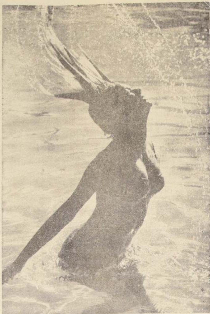
AGUA Y VIDA.— Al agitar su cabellera, haciendo que brote un raudal de perlas líquidas, esta muchacha evoca algún rito dionisiaco, mientras la alegría y el vigor juveniles se concentran en ella.