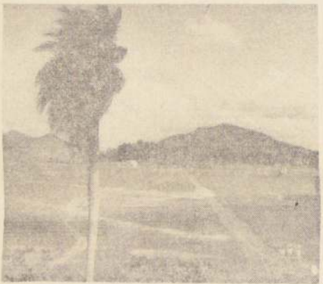
Un paisaje típico de la zona costera.