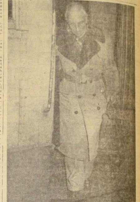
TALCA: El capitán Erich de Bisschop, a su paso por Talca, en camino a Constitución.

El capitán Erich de Bisschop, jefe de la balsa, es un francés de origen chileno. Lleva el control de la balsa, el que es estado por la Estación de Biología Marina de la Universidad de Chile.