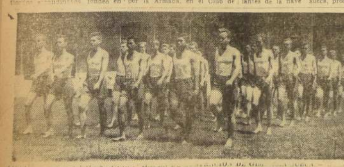
La zarpa de Valparaíso el Buque-Escuela "Alvsnabben" de la Real Marina de Suecia. Los 85 cadetes que viajan a su bordo, tuvieron ocasión de hacer variadas demostraciones de la clásica gimnasia sueca, sistema originario, como su nombre lo indica, del país sueco, incorporado a la enseñanza y cultura física de los más adelantados países del mundo. Una de las presentaciones las realizaron en la Escuela Naval. El grabado muestra a los cadetes suecos haciendo su desfile de ingreso a la cancha de césped, en que exhibieron sus habilidades gimnásticas.

HOY ZARPA PROSIGUIENDO SU VIAJE DE INSTRUCCION.— La tripulación y cadetes que tuvieron franco hasta la medianoche de ayer, quedó a esa hora totalmente recogida en su nave, preparándose para el zarpe que se efectuará hoy, a las 10 horas. El "Alvsnabben", proseguirá a El Callao, en viaje sin escalas.