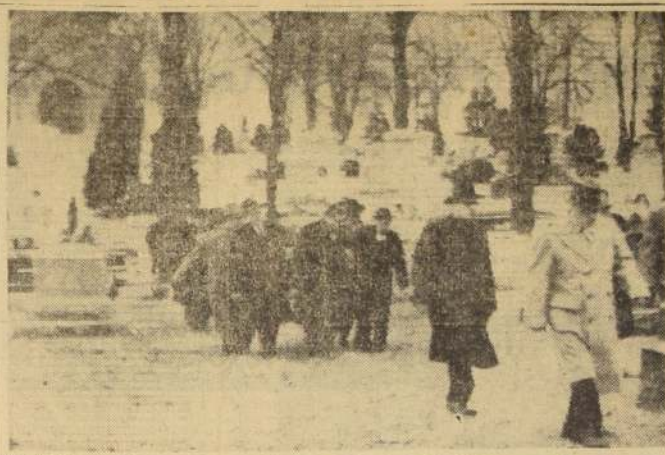
TERRE HAUTE, Indiana. — Los restos del diplomático de carrera, periodista y escritor, Claude G. Bowers, fueron sepultados en el cementerio de esta ciudad el 22 de enero. Al sepelio concurren representantes del Gobierno de Chile, políticos y amigos del extinto.

WASHINGTON, 23 (UP).— El Embajador de los Estados Unidos en Santiago de Chile, Cecil Lyon, dijo hoy que los Estados Unidos ya han aprovechado tres razones ventajosas para su política exterior.