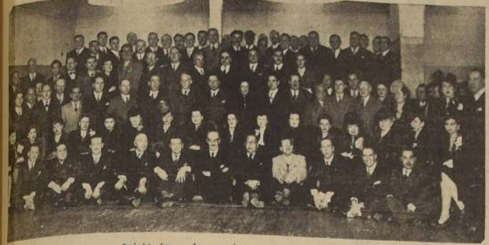
Asistentes a la manifestación de ayer