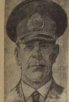
Excmo. señor General Edelmiro J. Farrell, Presidente de la República Argentina, que celebra hoy el 134.º aniversario de su Independencia