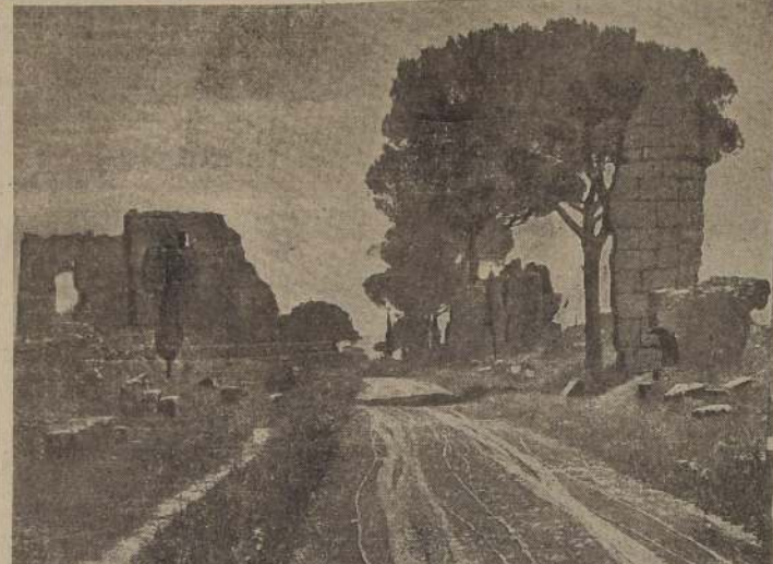
La Via Apia en las cercanías de Roma.