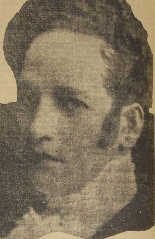
Antonio Corus, uno de los más grandes tenores del mundo, y quien la crítica de Madrid ha bautizado con el nombre de "El Gayerre actual". Hará doce funciones extraordinarias en la temporada del Municipal