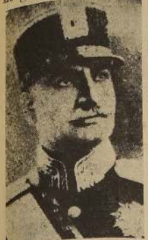
Riza Khan Pahlevi, ex Sha del Iran

DURBAN (Africa del Sur), 21 (U. P.).— Llegó a esta, proveniente de Mauricio, Riza Khan Pahlevi, ex Shah de Persia, quien seguirá viaje a América, después de una breve estadía en Natal. Se informa que el ex Shah sufre de una dolencia cardíaca y que seguirá un tratamiento en un sanatorio local.