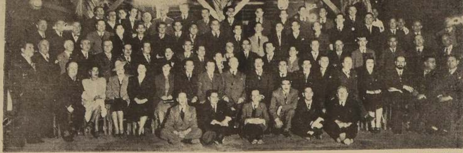
Vista parcial de la numerosa concurrencia que asistió a la gran manifestación popular ofrecida al señor Ministro de Salubridad

Se llevó a feliz término y con todo brillo en la Quinta Argentina. — Asistió una numerosa y distinguida concurrencia. — Interesante programa musical y artístico. — Los discursos