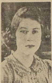
S. A. R. la princesa Isabel de Inglaterra

LONDRES, 21 (U. P.) — Con motivo de cumplir hoy 16 años la princesa Isabel, ofreció esta noche su primera fiesta oficial al recibir en una residencia de campo a 450 oficiales y soldados de un cuerpo de granaderos que la eligió hace pocas semanas "Coronel en Jefe". Posteriormente se realizó un baile en honor de la princesa.