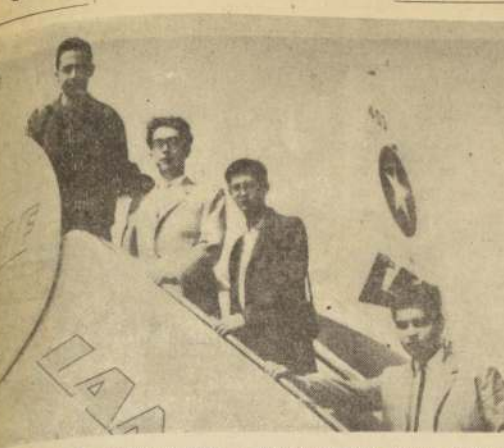
alumnos del ciclo superior. Darán conciertos en las principales ciudades nortinas, patrocinados por el Instituto Chileno-Norteamericano de Cultura.