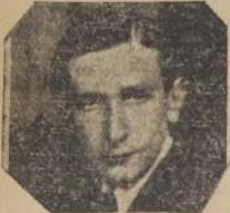
Tercer recital del genial pianista ruso