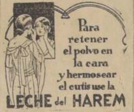
Para retener el polvo en la cara y hermosear el cutis use la

Sus funerales se efectuarán hoy a las 10 horas, después de unas solemnes honras fúnebres que tendrán lugar en la Iglesia del Cementerio General.