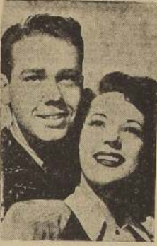
Richard Quine y Anne Gwynne en "CABALLERO DEL DESTINO".