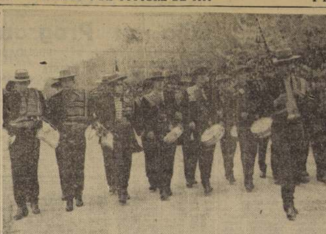
RANCAGUA. — Alumnos de la Escuela Agrícola de Quimavida, desfilan ante las autoridades, durante la ceremonia cívico-militar desarrollada ayer en la mañana en esta ciudad, para conmemorar el aniversario de la Batalla de Rancagua. — LUCERO, corresponsal.

FABRICA DE CUADERNOS "MISTRAL" JOSE ECHEVERRIA RUBIO Se ruega a los acreedores de esta firma, pasar por Tucapel 0293, Ñuñoa.