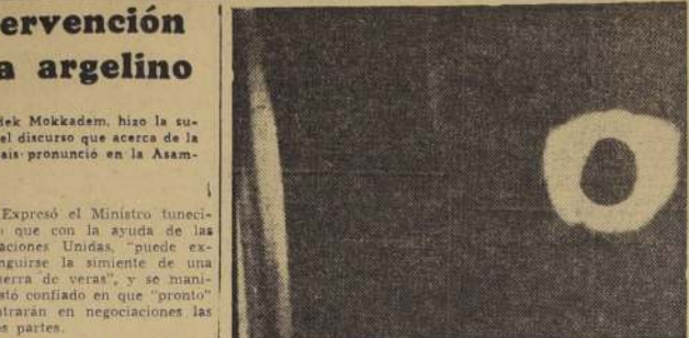
BOSTON. — Esta foto muestra el eclipse total de sol, de 56 segundos de duración, tomada el 2 de octubre, desde el aire, a una altura de 21.000 pies. Las nubes se pueden apreciar abajo (derecha).