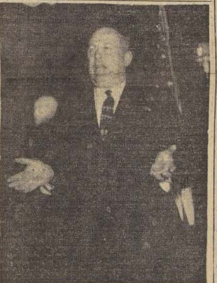
SUBSECRETARIO DE COMERCIO HABLA A LA PRENSA.

El sorteo se realizará el día 10 de octubre, a las 18 horas, en el Hotel Palace, Hotel Alcazarras, Hotel Mar Azul, Hotel Continental, Residencial San Ramón y Residencial García Morúa.