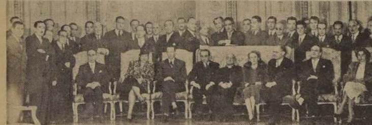
Asistentes a la manifestación ofrecida por la Sociedad Chilena de Filosofía a los distinguidos pensadores extranjeros que nos visitan, y que se llevó a efecto anoche en el Club de la Unión.