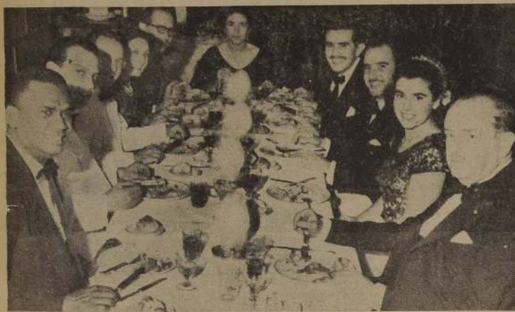
Aspecto de una de las mesas en la hora de comida en la Hosteria.