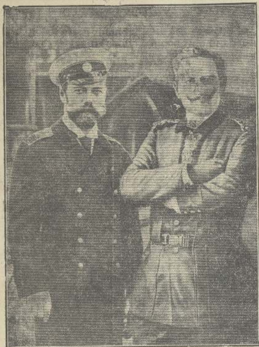
Guillermo II, Emperador de Alemania, y el Czar Nicolás de Rusia, entre quienes acaba de cambiarse telegramas personales, pero de carácter oficial, sobre la delicada situación producida entre ambos Imperios y cuya ruptura se espera de un momento a otro. Ambos Monarcas tienen estrecha relación de parentesco con el Rey de Inglaterra, Jorge V, quien en caso de producirse la conflagración europea, tendría que aliarse a Rusia y Francia para combatir contra Alemania, Austria e Italia.