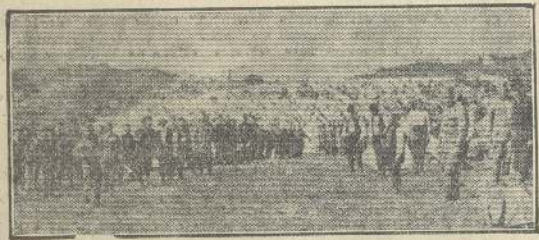
Soldados serbios trabajando en las líneas del ferrocarril de Belgrado, ciudad que acaba de abandonar el Gobierno, en previsión de que las tropas austriacas tomen de un momento a otro posesión violenta de esta plaza, que es la capital del Reino.