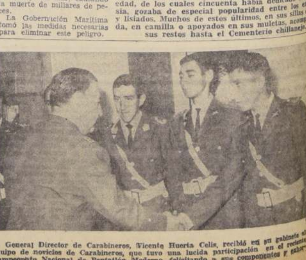
El General Director de Carabineros, Vicente Huerta Celis, recibió en su gabinete al equipo de periodistas de Carabineros, que tuvo una lucida participación en el reciente Campeonato Nacional de Pentatlón Moderno, felicitando a sus componentes y exhortándolos a superarse en el futuro.