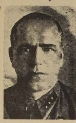
General Zhukov, defensor de Moscú

Después de un año de incesante combatir, los alemanes, que esperaban vencer a Rusia en 6 semanas, continúan desgastando sus fuerzas contra los ejércitos defensores que guarnecen el vasto frente que va del Artico al Mar Negro