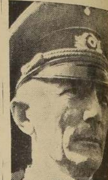
Resumen de la campaña rusa hizo I. Kalinin

personalmente al comando supremo alivo. 30 de diciembre, reconquista de Kerch. En enero, febrero y marzo, los rusos socoran sin cesar al enemigo, causando elevadas pérdidas. En 15 de marzo, había Hitler prometiendo la derrota de Rusia en este año. 26 de abril, Rusia anuncia oficialmente que los alemanes han perdido un millón de hombres desde el comienzo de la ofensiva soviética en diciembre. Hitler, admitiendo esta perspectiva de otro invierno en el frente ruso. 2 de mayo, comienza la ofensiva alemana en Kerch. 13 de mayo, los alemanes atacan a su vez, una gran contraofensiva en la zona de Khar'kov. 18 de mayo, Berlín anuncia la total ocupación de Kerch.