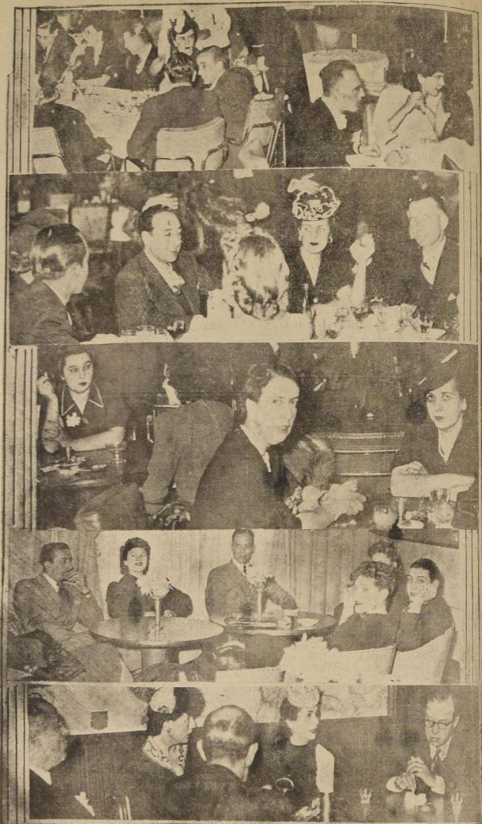
Con una afluencia creciente de un público selecto y distinguido, se ven, día a día los salones del Carrera concurridos por destacadas personalidades de nuestro mundo social. Presentamos varios aspectos correspondientes al Living, Grill Room, Bar Central, Baby Bar y Roof Garden.