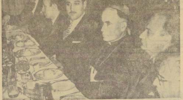
CONFERENCIA DEL CARDENAL.—Durante una sesión, almuerzo, organizada por el "Serra-Club", el Cardenal y Arzobispo de Santiago, Monseñor Raúl Silva Henríquez, dio a conocer ayer diversos aspectos relacionados con el Concilio Ecológico, a realizarse próximamente en el Vaticano. EN EL GRABADO, el Cardenal aparece rodeado de Periodistas, y otras personas.