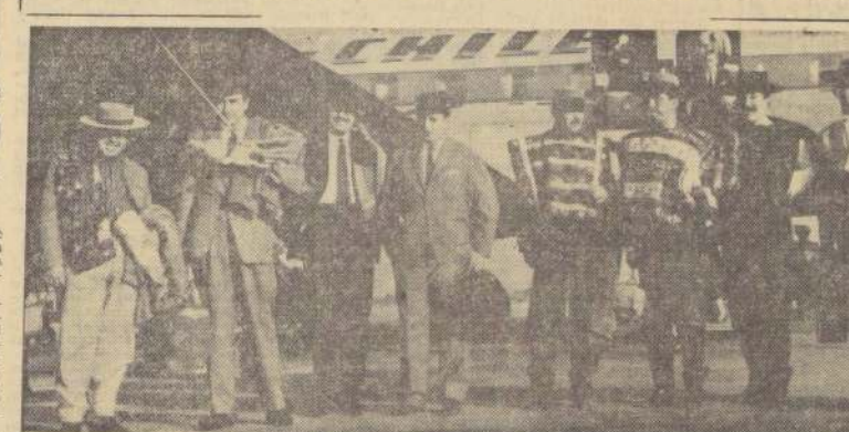
Via LAN-Chile regresó ayer, procedente de Buenos Aires, la delegación de husos que ofrecieron un "Rodeo a la Chilena" e hicieron pruebas de riendas, en la capital de la Plata, con motivo de celebrarse recientemente las Festividades Patrias. Los actos fueron organizados por la Embajada chilena ante el Gobierno argentino. De exitosa fue calificada la presentación de los representantes de nuestros campos, el domingo pasado y que consistió en bailes de cuecas, corrida de novillos y pruebas de habilidad individual en el manejo de sus caballos. El éxito que alcanzó la actuación de nuestros husos dio motivo a que el diario "Clarín", de Buenos Aires, titulara en su edición del lunes pasado: "Chile, lindo como el sol". EN EL GRABADO, parte de la delegación de husos, instantes después de descender del avión que los condujo de regreso a la patria, en el aeropuerto de Los Cerrillos.

La Cámara de Representantes dio hoy su aprobación definitiva a la solicitud del Presidente Kennedy para que se le autorice a llamar a las reservistas al servicio activo. La aprobación se produjo luego de haber expuesto a la Cámara el representante Carl Vinson, presidente de la poderosa Comisión de Servicios Armados, que al bien de los Estados Unidos, debían actuar con calma y juicio al evaluar la situación de Cuba, están de haberse expuesto a la Cámara cualquier acción por parte de Fidel Castro.