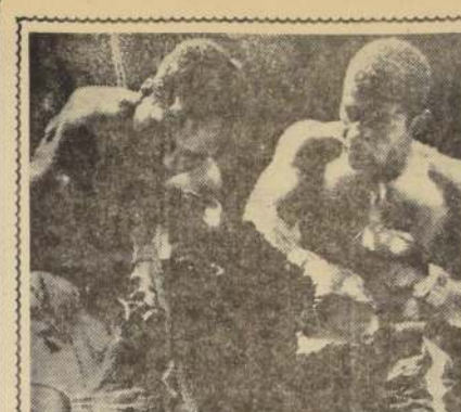
FLOYD PATTERSON defendiendo esta noche su corona de campeón del mundo de todos los pesos frente a su hermano de raza Sonny Liston. Aparece como el gran combate en muchos años. En la nota gráfica, el campeón castiga a uno de sus rivales más recientes.

La programación fijada por la Asociación, ha concentrado los partidos más importantes en el Estadio Fama.