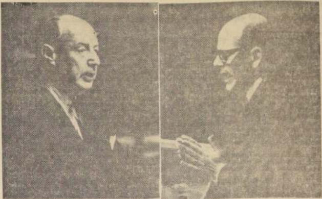
NACIONES UNIDAS.— La tensión entre los EE. UU. y Cuba ha tomado ahora la forma de discusiones en la Asamblea General de las Naciones Unidas y el duelo verbal ha sido sostenido por Adlai Stevenson, a la izquierda y Mario García Inchaurri, a la derecha. Las fotografías fueron tomadas durante el cambio de discursos ocurrido la semana pasada, a poco de comenzar las deliberaciones de la Asamblea. (FOTO UPI).