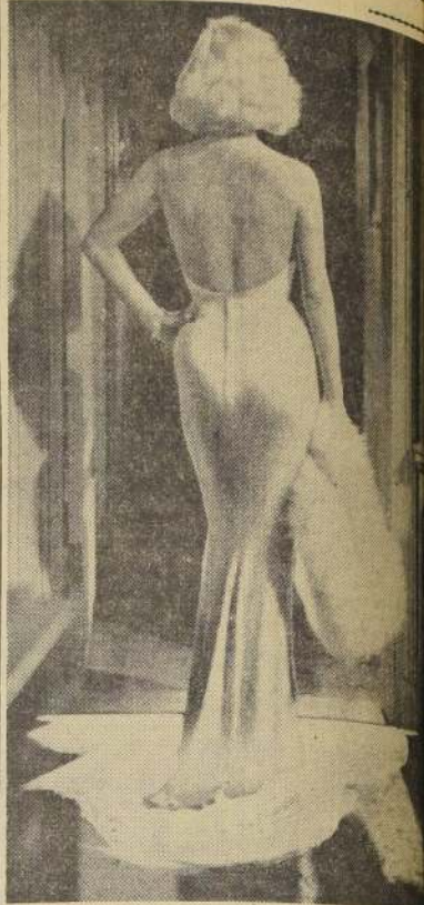
SON LOS SWEATERS DE MAMIE. — En la película "Escuela del vicio", Mamie Van Doren, que da la espalda, usa tres diferentes sweaters, que ella, son "estrictamente para hombres". El film revela los vicios de la juventud moderna.