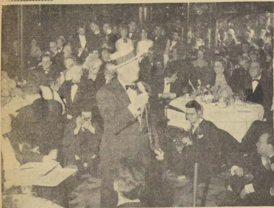
DESPUES DE "GIGI". — Después de haber asistido a la premier de gala de "Gigi", efectuada en un gran cine de los Campos Eliseos, Maurice Chevalier corrió a cantar al viejo "Maxim's" a beneficio de los retrainistas de París. Hélo ahí, deleitando como en sus jóvenes tiempos. — (Foto Intercontinental).