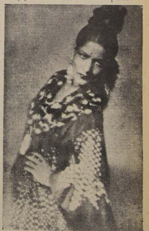
La insigne danzarina y actriz gitana española Carmen Amaya, estrella de la romántica película de ambiente andaluz, «MARÍA DE LA O». En ella adquiere vigorosa vida la leyenda de una ranguera gitana y la influencia que ella tuvo en un drama de amor, cuyo protagonista masculino corre a cargo del admirable astro español Julio Peña. En esta cinta tiene importancia especial la famosa copla de S. Valverde y R. de León: «María de la O... — qué desgraciada gitana tú eres... — teniéndola tú...»

El arte imponderable de Carmen Amaya contribuye a hacer de «María de la O» una joya del cine hablado en español