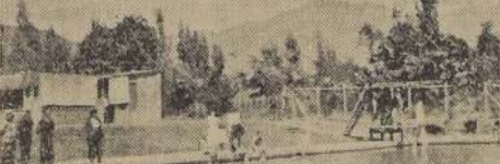
Un rincón de la Piscina Municipal

—Próximamente el presidente de la Universidad de Concepción dictará una conferencia en la Escuela de Artillería Naval, sobre "La democracia ateniense y Sócrates". (Echeverría, corresponsal).