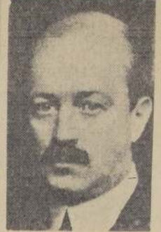
Señor don Julio Roca, hijo del general, actual Vice-Presidente de la República Argentina.

El 19 de octubre de 1914, el general Roca dejó a su patria una de las páginas ejemplares más limpias y más honrosas que se han escrito en la historia argentina, y a su hogar una nobilísima tradición, que hoy encarna el actual Vice-Presidente de la República, quien, además de llevar con honor el nombre de su padre, ha querido singularizarse por su adhesión a la política de amistad chileno-argentina en forma que, como en otro tiempo lo hiciera su ilustre progenitor, el Consejo sereno y la inclinación cordial y amistosa del Vice-Presidente señor Julio Roca, nunca han dejado de oírse cuando alguna sombra amenaza la vinculación entre nuestros dos pueblos.