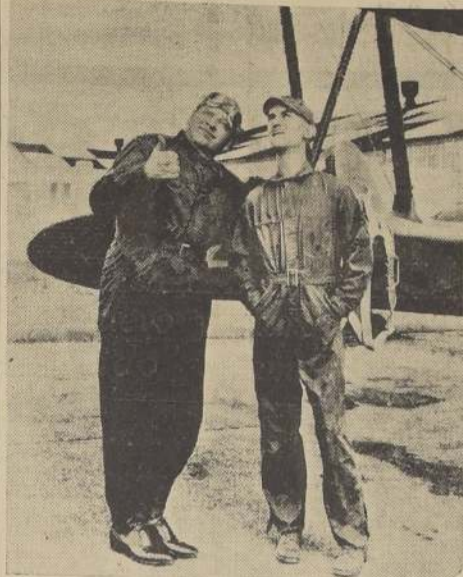
Wallace Beery en una de las escenas de la gran película de aviación "Aguilas humanas", que conoceremos la próxima semana