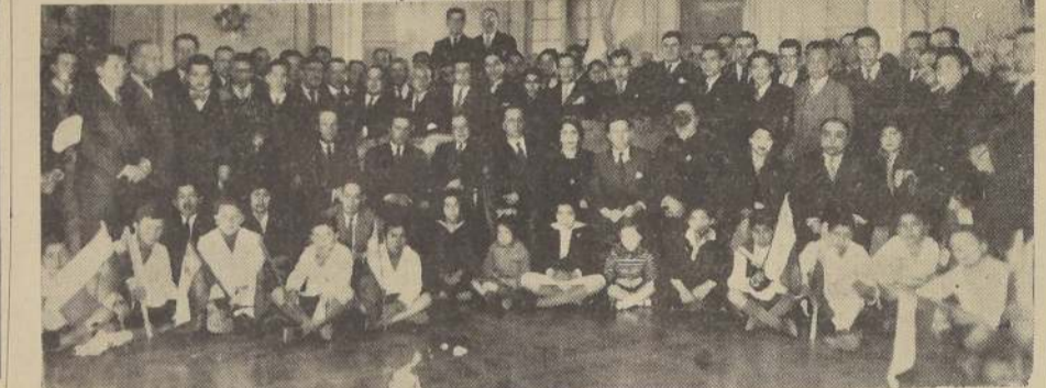
Miembros de la Colonia Ecuatoriana residente en la Legación de ese país

Con diversas festividades se celebró ayer en esta ciudad el aniversario de la emancipación política de la República del Ecuador.