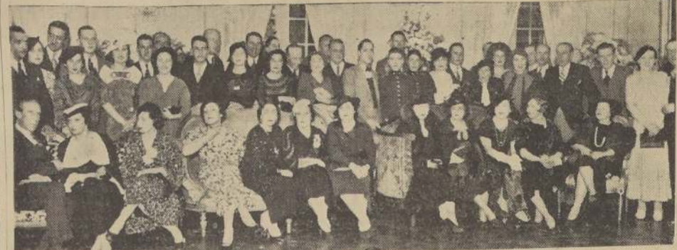
Durante la recepción de ayer en la Legación del Ecuador

NOTA. — Compró todo objeto y muebles de arte, siendo de calidad, evite pago de comisiones.