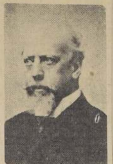
General don Julio A. Roca, ex-Presidente argentino, a quien el Congreso de su país ha acordado erigir un monumento en Buenos Aires, por los importantes servicios prestados al país.

El Gobierno y el pueblo argentino, procurando cancelar una deuda de gratitud nacional con uno de sus hombres de Estado más eminentes, han celebrado entusiastamente la autorización legislativa, recientemente aprobada por el Congreso de aquel país, para levantar una estatua que perpetúe la memoria del ex Presidente de la Nación.