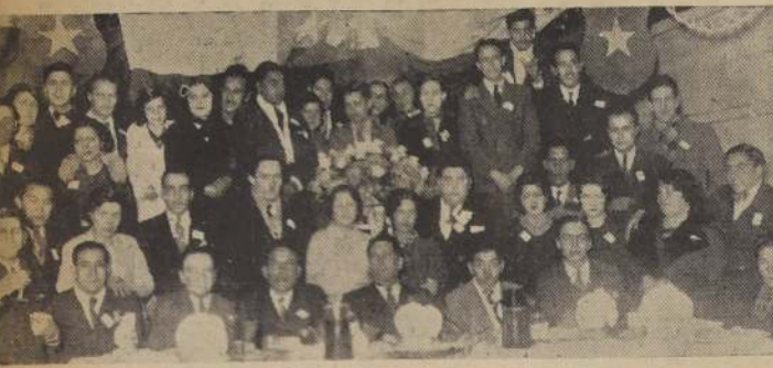
Aspecto del banquete, con que los socios activos, cooperadores y honorarios del Conjunto Artístico de Aficionados "Eloy Rosales", celebraron el octavo aniversario de la institución. Este grupo es una de las entidades artísticas bien organizadas, serias y estudiosas. — Viene actuando, con éxito, en todos los Certámenes del Depto. de Extensión Cultural.