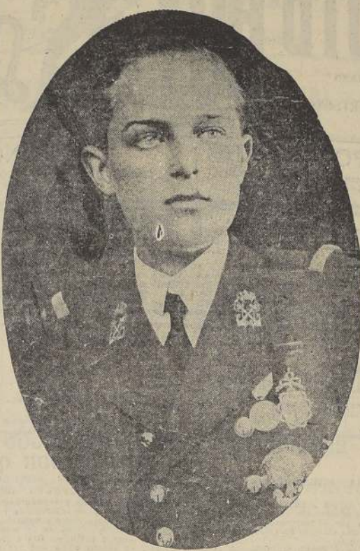
El Príncipe de Asturias, don Alfonso de Borbón, heredero al trono de España