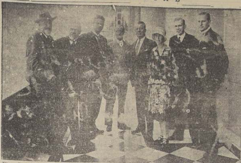
El ex-Zar Fernando de Bulgaria en un almuerzo que le fué ofrecido ayer en el Club de la Unión