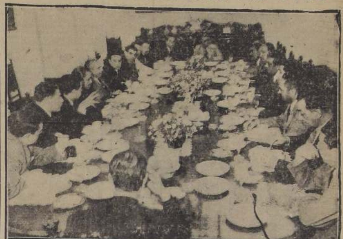
S. E. el Presidente de la República, departe cordialmente con los redactores políticos durante las once que les ofreció ayer

da intención, sin el menor ánimo de herir a nadie, ya que los deseos eran de evitar que se siguiera concediendo amplitud ilimitada al crédito que en nuestro país ha sido aprovechado con el exclusivo objeto de hacer especulaciones que encarecen el costo de la vida, eleva los costos de la producción y permite que sectores importantes de la ciudadanía se aprovechen en la utilización incontrolada e indebida del crédito para hacer ganancias exorbitantes en perjuicio de la gran masa del país.