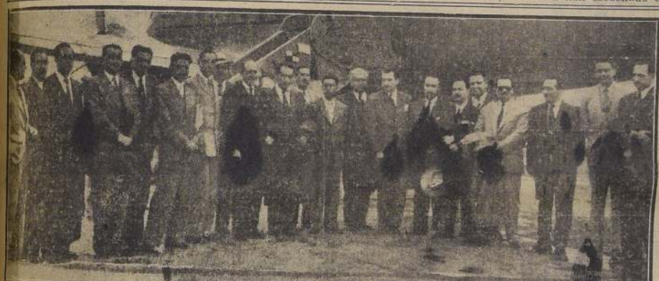
La delegación de periodistas chilenos que visita la capital peruana, momentos después de descender del avión que los condujo al aeropuerto de Lima. — El séptimo, contando desde la izquierda, es el director de "LA NACION".