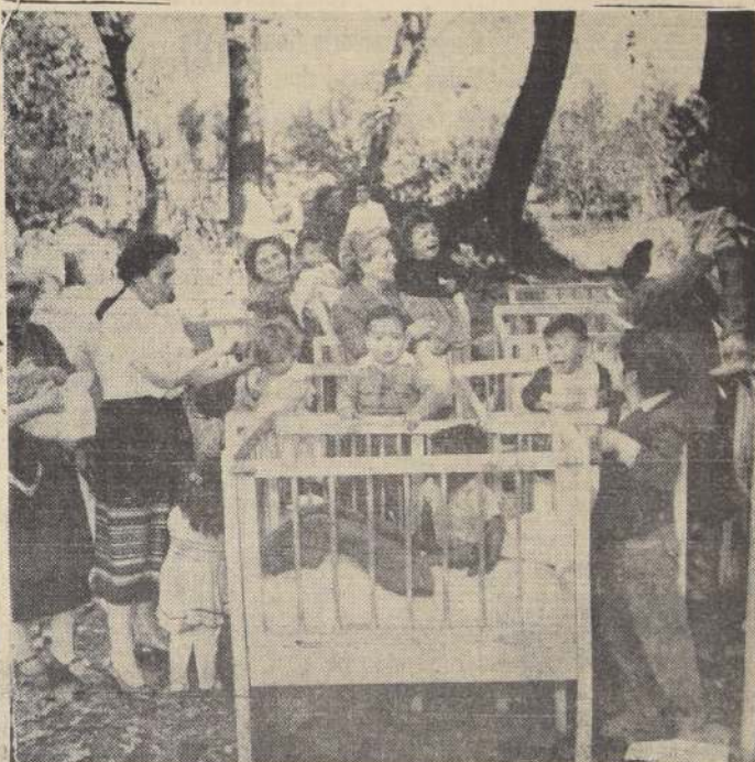
Esposas de los funcionarios de la Moneda, Corporación de la Vivienda y de la Intendencia, asistieron ayer con solcito cuidado a los hijos de las treinta y dos familias trasladadas a los sitios urbanizados de San Gregorio. A los pequeños se les proporcionaron alimentos, vestuario, atención médica y otras atenciones, las que recibieron con especial agrado.