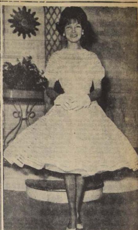
CROQUET, de la Casa Garven, confeccionado en broderie blanco, muy apropiado para la hora del coctel para una debutante.