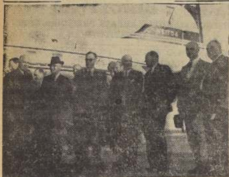
El Embajador de Estados Unidos en Santiago, Walter Howe (izquierda), da la bienvenida a sus colegas de Argentina, Perú, Paraguay, Venezuela y Uruguay, que llegaron a Santiago a participar en una conferencia de diplomáticos norteamericanos.