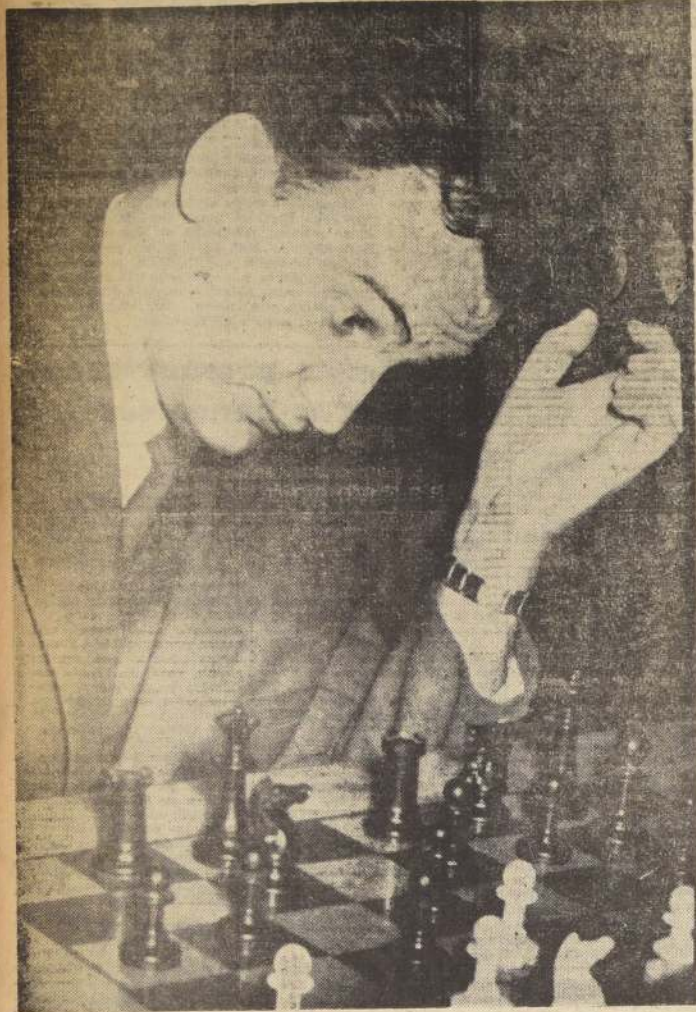
BORISLAV IVKOV.— Habil jugador yugoslavo que no obstante perder un partido con el chileno René Letelier, ocupó siempre el primer lugar del torneo internacional de ajedrez. Lo vemos aquí en el grabado en una acción muy característica.