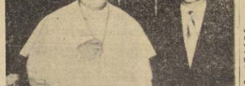
El golpe contra Oliveira Salazar, jefe del Gobierno portugués, fracasó. Los 31 detenidos, entre ellos los ministros, están siendo sumariados.