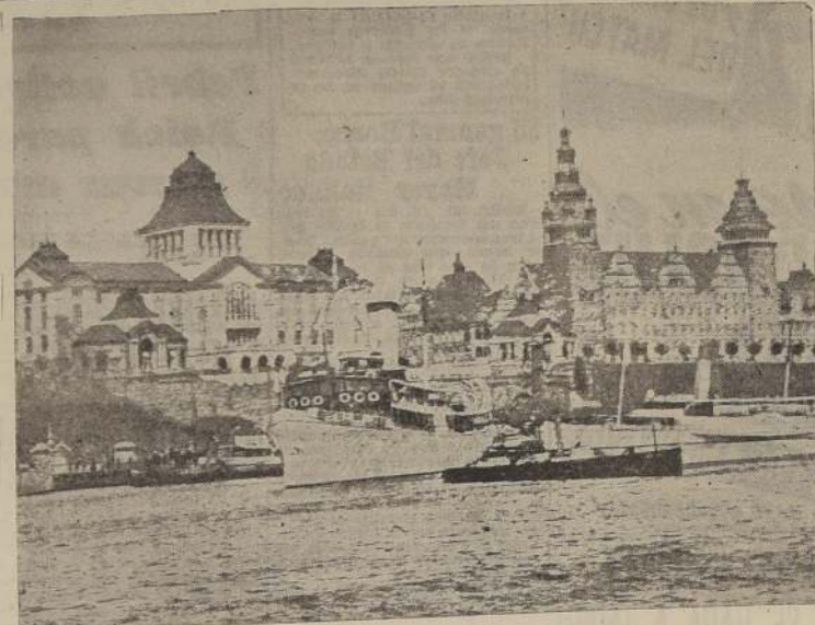
Una vista de Stettin mostrando la terraza de Hacken, el Museo Municipal y el Palacio de Gobierno. Esta ciudad que hasta 1873 fue una fortaleza se encuentra ubicada en la orilla izquierda del río Oder y comunica con sus barrios mediante tres puentes principales, aparte del ferroviario. Tiene numerosas plazas públicas, muchas de las cuales cuentan con grandes monumentos como los de Federico el Grande y el de Federico Guillermo III. De sus nueve iglesias evangélicas, cabe destacar la de San Pedro-Grande y la de San Juan, la monumental de su construcción y por considerarse como la primera iglesia cristiana levantada en Pomerania. En cuanto a su historia, fue primeramente una colonia de los vándalos y aparece por primera vez como principal centro comercial del Oder en el siglo XII con la destrucción de Jümmen por los daneses. En 1243 recibió el derecho de ciudad alemana por el duque Bardeleben perteneciente a la Confederación Teutónica y en 1523 aceptó la Reforma. Stettin fue escenario de la firma del tratado de paz entre Suecia y Dinamarca, por mediación del emperador. Fue redimida en 1573 a Gustavo Adolfo y más tarde a Suecia a raíz del Tratado de Paz de Westfalia, junto con toda la Pomerania. En 1713 fue ocupada por Prusia y Holstein por la Paz de Estocolmo y en 1720 fue entregada definitivamente a Prusia. Después de la catástrofe de 1806 fue entregada a los franceses que se mantuvieron en ella hasta 1813. 60 años más tarde dejó de ser fortaleza. En la actualidad afronta el peligro de las fuerzas rusas que avanzan en su dirección.