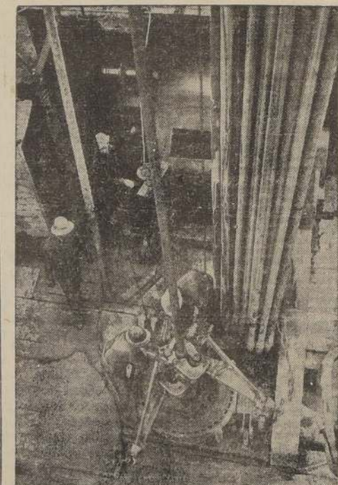
Una vista de uno de los pozos de petróleo de Inglaterra. Su explotación se mantiene secreta; pero se ha revelado que su producción alcanza a 100.000 toneladas anuales.