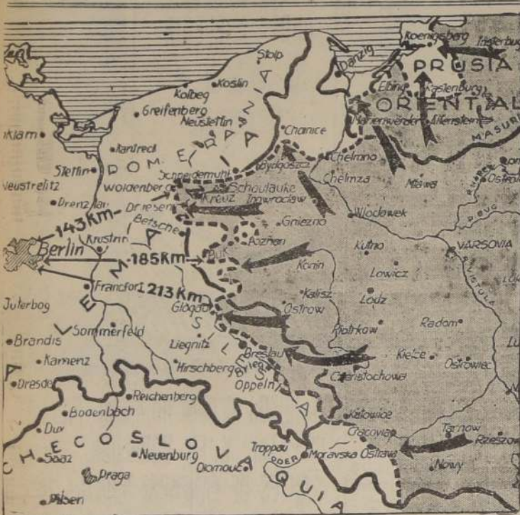
La línea cortada señala aproximadamente la situación del frente germano-ruso. Informaciones de última hora colocan a las fuerzas soviéticas a sólo 116 Km. de Berlín. Los principales objetivos inmediatos de los invasores parecen ser Stettin, Kustrin y Frankfurt.