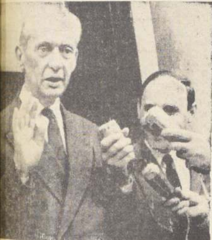
El nuevo Primer Ministro francés, Maurice Couve de Murville, se encuentra en los trámites finales para la constitución de un gobierno que afronte la realización del programa prometido por el Presidente De Gaulle, con reformas sociales y económicas de gran envergadura.

Comentó, también, que "pasará gran parte del tiempo con el general Abrams, quien recientemente asumió el comando de las fuerzas norteamericanas en reemplazo del general William C. Westmoreland". Clifford añadió que sostendrá extensas conversaciones con el Vicepresidente Kao Ky y el Primer Ministro Huong, posiblemente sobre cuestiones económicas, diplomáticas y asuntos de pacificación, lo mismo que acerca de la situación militar.