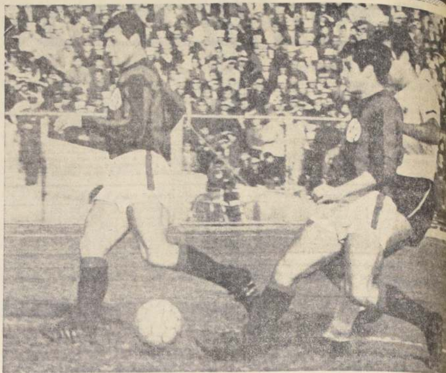
GOL DE COLO COLO.— Beirut, con su característica pujanza, luchó con la defensa de San Lorenzo y, totalmente marcado, alcanzó a puntear la pelota para introducirla en la valla. Fue el primer tanto del cuadro albo.

■ La etapa final fue muy poco. San Lorenzo "hacía" sin interés (aparte del de Fischer) por hacer más goles y los locales dominando pero sin claridad ni posibilidades de concretar en goles ese dominio territorial. Un poco de emoción ante las oportunidades malogradas por Valenzuela, Beiruth, el propio Toro, pero nada que se aproximara a la calidad de los 45 minutos iniciales, con los que debió conformarse la excepcional cantidad de aficionados que se dieron cita ayer en el Nacional. JUAN CARLOS FRANCO