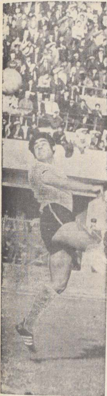
Ni con "Torito" —un refuerzo cuya actuación había causado viva expectación— estuvo "El Cacique" en condiciones de poner en peligro el triunfo —cuatro por dos— de San Lorenzo de Almagro. Se ve al titular del Modena y sensación del mundial del 62, en una de sus intervenciones.

Por primera vez un Gobierno realiza una tentativa sistemática y organizada para dar la máxima eficiencia a la labor de la Administración del Estado