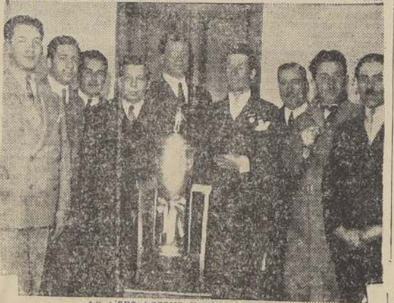
La copa Lozano y sus ganadores.

sortada. Ya se creía asegurado el triunfo del Club San Bernardo, cuando los "nacionales" en forma imponente consiguieron obtener 1.070 puntos, es decir, un puntaje con la ventaja mínima precisa para vencer al San Bernardo.