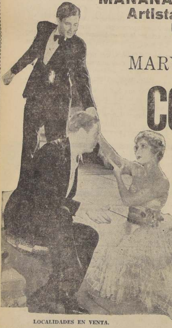
LOCALIDADES EN VENTA.