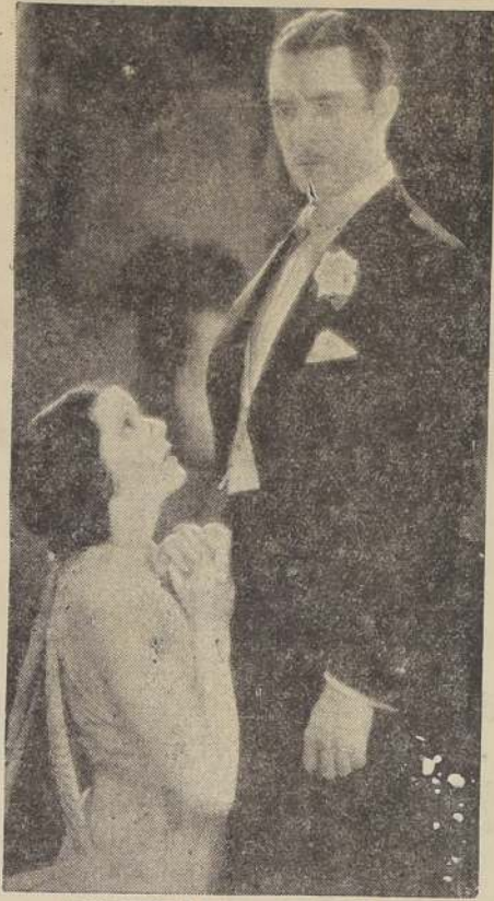
ARGUMENTO EN "CINE NOVELA"