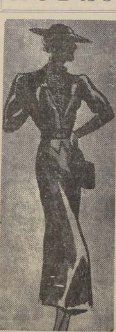
Vestido de lana cloqué negro. Chaleco rayado blanco, rojo y azul.