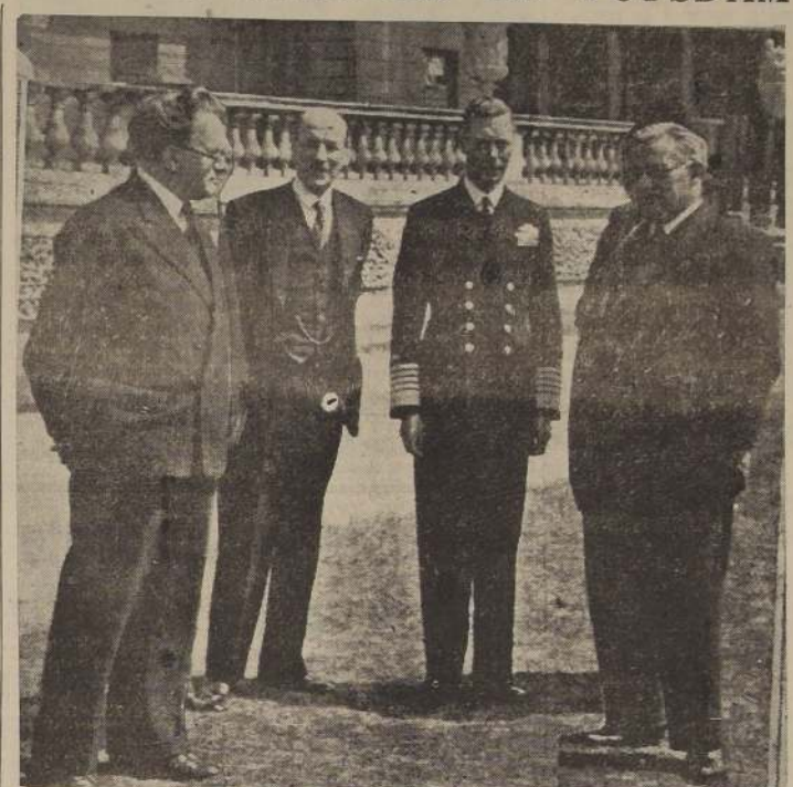
El Premier, en compañía del Rey y de dos de sus nuevos Ministros, Morrison, a la izquierda y Bevin, a la derecha.

Los REYES EN DESTIERRO. Hace tiempo que se venían