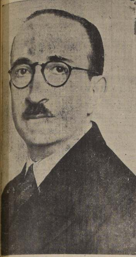
Excmo. señor José Luis Bustamante y Rivero, Presidente Constitucional de la República del Perú.

Hoy asumirá el mando el nuevo Presidente peruano