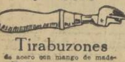
Tirabuzones de acero con mango de mader, $ 0.80