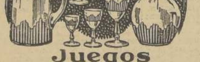
Juegos de copas de cristal "Portieux", cortado, compuesto de 62 piezas, a $ 135.-