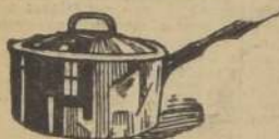
Cacerolas con mango de hierro enlacado importado, 4 litros, $ 8.50, Mitros, $ 6.90, y un litro, $ 4.90