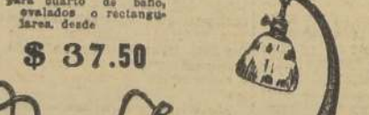
ESPEJOS para cuarto de baño, esvelados o rectángu- lares, desde $ 37.50