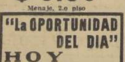
"La OPORTUNIDAD DEL DIA" HOY Camisa o calzon con refuerzo en jer- sey algodón, colores muy variados, haciendo juego, ta- lles 42-50, la pieza $ 2.90