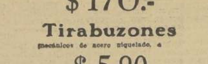
Tirabuzones mecánicos de acero niquelado, a $ 5.90