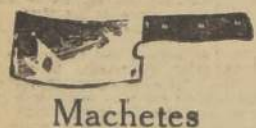
Machetes para picar verdura o carne, a $ 4.50