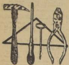
Juegos de 4 herramientas, a $ 4.90