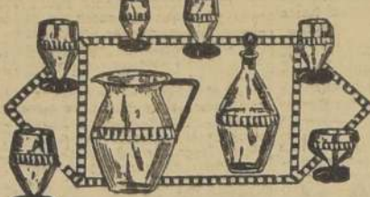
Juegos de copas de cristal Heigl, forma mo- derna, con pie color amatista, compo- nente de 74 piezas, a $ 170.-