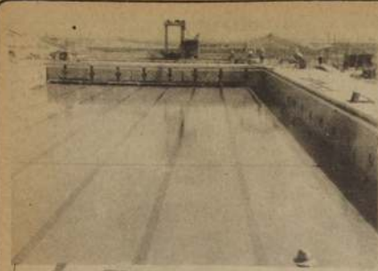
LA PISCINA OLIMPICA, sin dudas la mejor de Chile, permanece vacía. En marzo se llenará de record.