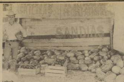
Ramada que tiene en Renca el Centro de Reforma Agraria "Pedro Aguirre Cerda". Así, los agricultores venden directamente al consumidor.