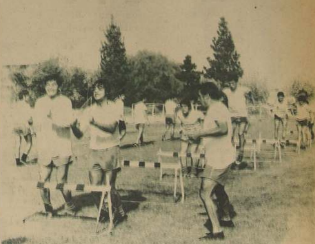
La "U" mostró frente a Rosario un estado físico privilegiado. Y se trabaja para mantenerlo durante la Copa.

El punto más delicado de la reunión es el que se refiere a la repartición de los jugadores que se han comprometido a jugar en la temporada 1972. En este punto, los jugadores figuran tres equipos postulando, el mismo balance, que terminó último en el certamen anterior. Avanza y Trastorno. Otro punto a tratar es la fijación definitiva de la división del torneo de primera división, que tiene una fecha del 12 de marzo, pero que puede ser modificada en la reunión que se celebrará este mismo día en el club de la Unión.