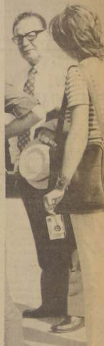
EL COMPAÑERO Presidente, en diálogo con los periodistas de Concepción, en el aeropuerto de Carriel Sur.

EL "HIPPIE" melenudo y barbón de la foto (izquierda) se presentó a la Escuela Militar como alumno aceptado para el año docente 1972. Un Subalférez y un cadete le anuncian que en breves instantes más deberá poner fin a su abundante cabellera y a su poblada barba. Naturalmente, no hubo oposición a las exigencias del plantel militar, y así vemos, en la foto inferior, casi irreconocible, al mismo futuro cadete. A la metamorfosis capilar —parece decirle el Teniente Instructor— seguirá la otra la que impone el Reglamento de Disciplina.