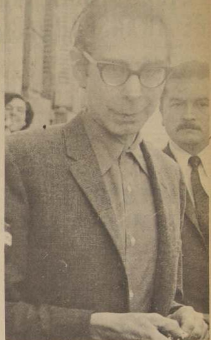
Carlos Altamirano, Secretario General del Partido Socialista. Pleno del Comité Central ratificó acuerdo de formar Partido de la Unidad Popular.

Por su parte, sectores de la democracia cristiana han intentado infructuosamente descalificarla en base al rechazo de los pactos electorales, pero como la posibilidad de que se fusionen los partidos y movimientos de la UP en un partido se proyecta mucho más allá del aspecto meramente electoral, han debido guardar prudente silencio.