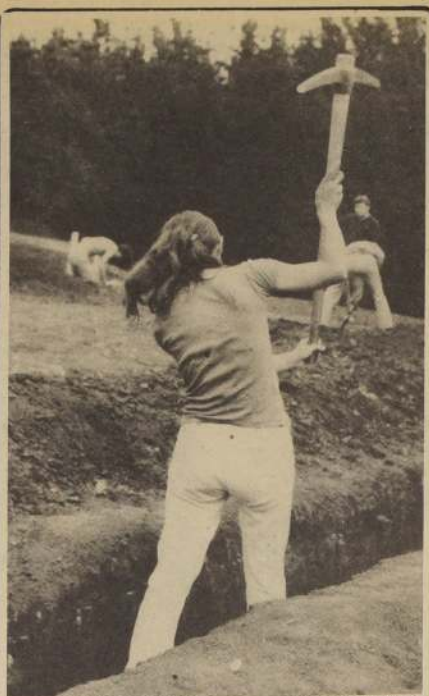
UNA JOVEN ESTUDIANTE que participa en los trabajos Voluntarios de la FECH, trabajando en un surco, con sus compañeros del Campamento de Concepción.