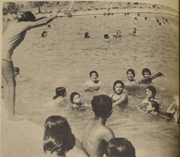
LA ESCENA, que se repite a lo largo de todo Chile, mostrará sus frutos. Los nuevos nadadores se medirán el 29 de Santiago.

La competencia de hoy, entonces, asegura no sólo un número record de participantes, sino también excelentes cronos.