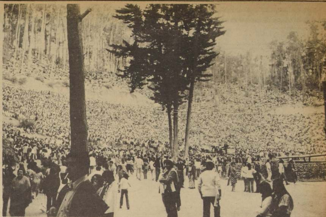
La Quinta Vergara se hizo estrecha. Fue la respuesta de los porteños a los interesados en que el festival debía terminarse. Aquella noche, fuera de los derrotados en el campo musical, hubo muchos derrotados en las butacas. Todos aquellos que no querían que este festival tuviera el éxito ya conocido. La fotografía muestra el escenario, a las 17 horas, cuando ya no cabía nadie más. Una respuesta que la dio el pueblo.