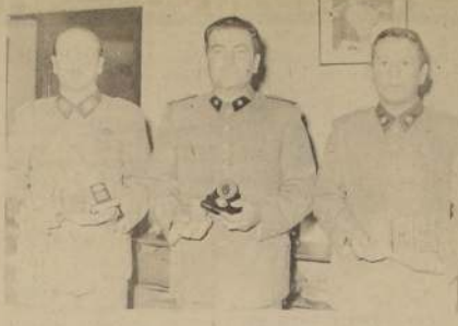
Los tres miembros del equipo chileno que participaron en el Campeonato Panamericano Militar de Panamá muestran los Premios obtenidos en ese evento, durante la visita que hicieron ayer en la mañana al Comandante en Jefe del Ejército, General Carlos Prats.

Además, se sabe que cometió robos en la cooperativa pues se apropió de una máquina de sumar que vendió de herramientas de construcción, vendió dos casas prefabricadas y adulteró documentos falsos presentando balances inexistentes, aprovechándose de los servicios de una persona que no es contador.