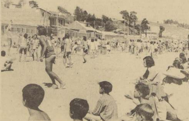
Y SAN SEBASTIAN también se "metió" en el baile. Mas de treinta redes animaron el fin de semana.

El Campeonato, además, inaugura este fin de semana la división adulta, en donde se disputarán todos los torneos que se encuentren en el estado físico y que no sean verdaderamente recreativos. Se trata, pues, de un torneo para los mayores de 18 años, que presentará un equipo de élite, ya que se supone que la mayoría de los participantes son expertos. El torneo se efectuará para el campeonato de Ventanas, Reñaca y Las Cruces desde las 15.30 horas sábado en adelante.