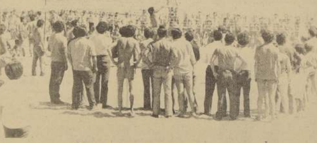
REÑACA SE REPLETO de deportistas y adquirió un nuevo rostro, más recreativo y más sano.