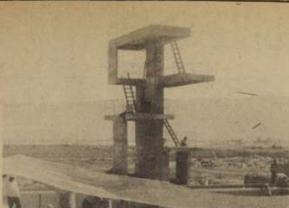
LOS TRAMPOLINES esperan en silencio los aplausos... una mano de pintura y listo para los competidores.