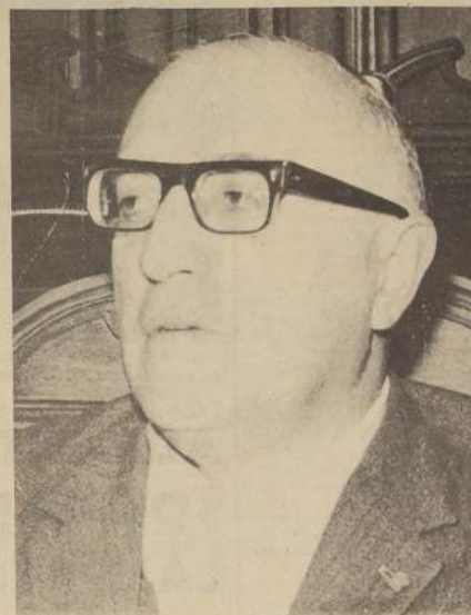
Diputado Orlando Milas, miembro de la Comisión Política del Partido Comunista, participa en Comisión Coordinadora que estudia formación del Partido de la Unidad Popular.

Trascendió por otra parte, que en la reunión del Comité Político se acordó otorgar atribuciones de tipo político a la Comisión Coordinadora-