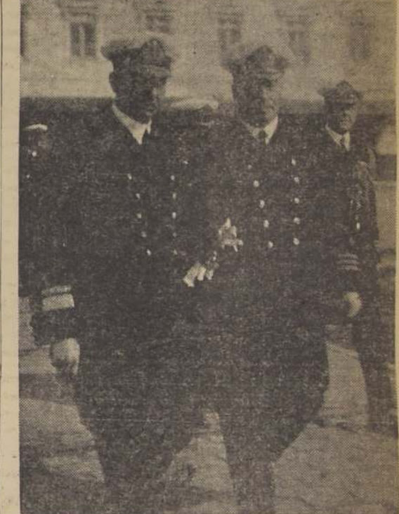
El ministro de Marina, dirigiéndose a bordo en compañía del jefe del Apostadero Naval, contralmirante Nieto.

Además, manifestó que en todos los viajes realizados por la corbeta "Baquedano" a países extranjeros, la bandera de la patria se había mantenido siempre en el mástil glorioso de las buenas y nobles acciones de los marinos chilenos. En esta ocasión, agregó, puedo manifestar al señor ministro, que nuestro pater-