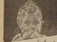
Fuerza, salud y felicidad

SHANGHAI, 12 (U. P.). — Despacos japoneses procedentes de la frontera de las provincias de Chensi y Honan, sostienen que el ejército japonés, en su mayor parte desorganizado, se ha retirado de la zona de Peiping y Hankow. Se dice que el ejército japonés ha sufrido una gran pérdida de efectivos en la batalla librada entre Peiping y Hankow.