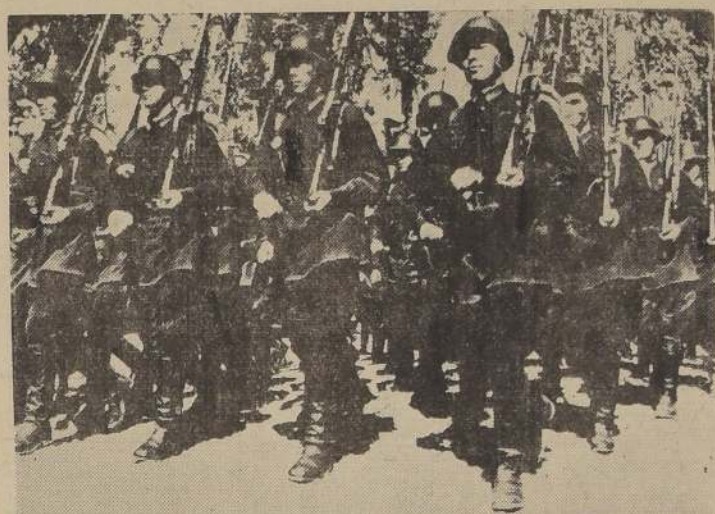
Infantería rusa dirigiéndose al frente de batalla.

Esta mañana se hizo por vez primera un ensayo de los preparativos hechos para el caso de un ataque a Moscú por el aire.