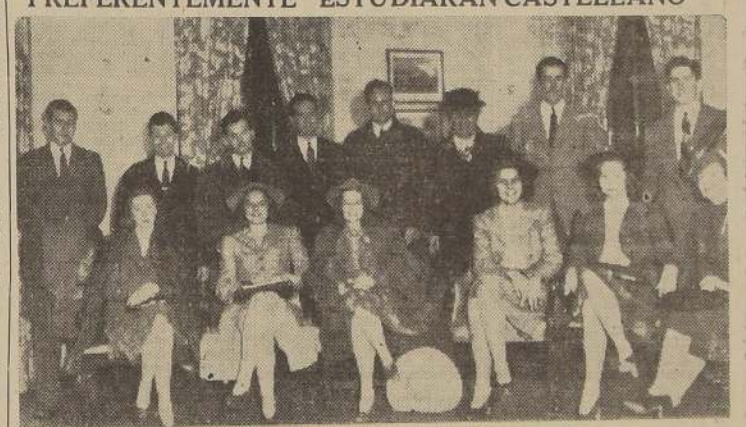
Los estudiantes norteamericanos, que llegaron ayer.