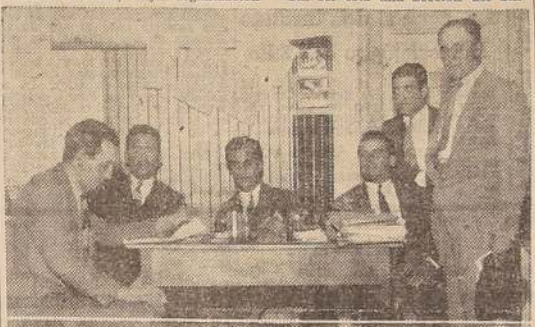
La Mesa Directiva en funciones.