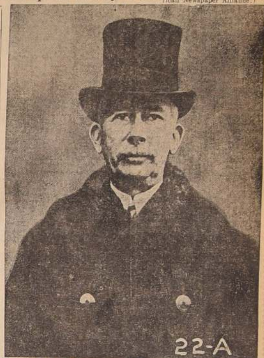
El coronel E. M. House, uno de los personajes más influyentes cerca del Presidente Wilson, fotografiado durante la guerra.

Claro que urgía que los especialistas y trabajadores necesarios en Francia para construir y levantar nuestros medios de alojamiento, fuesen enviados tan pronto como se encontrase adecuado empleo, pero nada debió de haber pospuesto la movilización inmediata de las unidades de combate de las fuerzas regulares y de la Guardia Nacional.