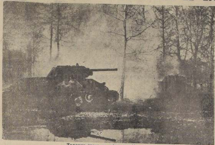
Tanques rusos en plena acción.

MOSCÚ, 29. — (U. P.). — La agencia noticiosa Tass publica que el tribunal alemán ha condenado a muerte a una mujer alemana que se negaba a trabajar para una prole alemana de tierras. La sentencia rebusca que "la mujer que rehúsa trabajar para los alemanes pagará una multa negativa con la vida".