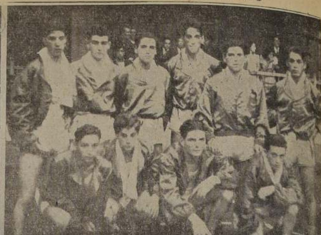
Equipos de Iquique, Concepción y Temuco, que han tenido destacada actuación en el Campeonato Nacional