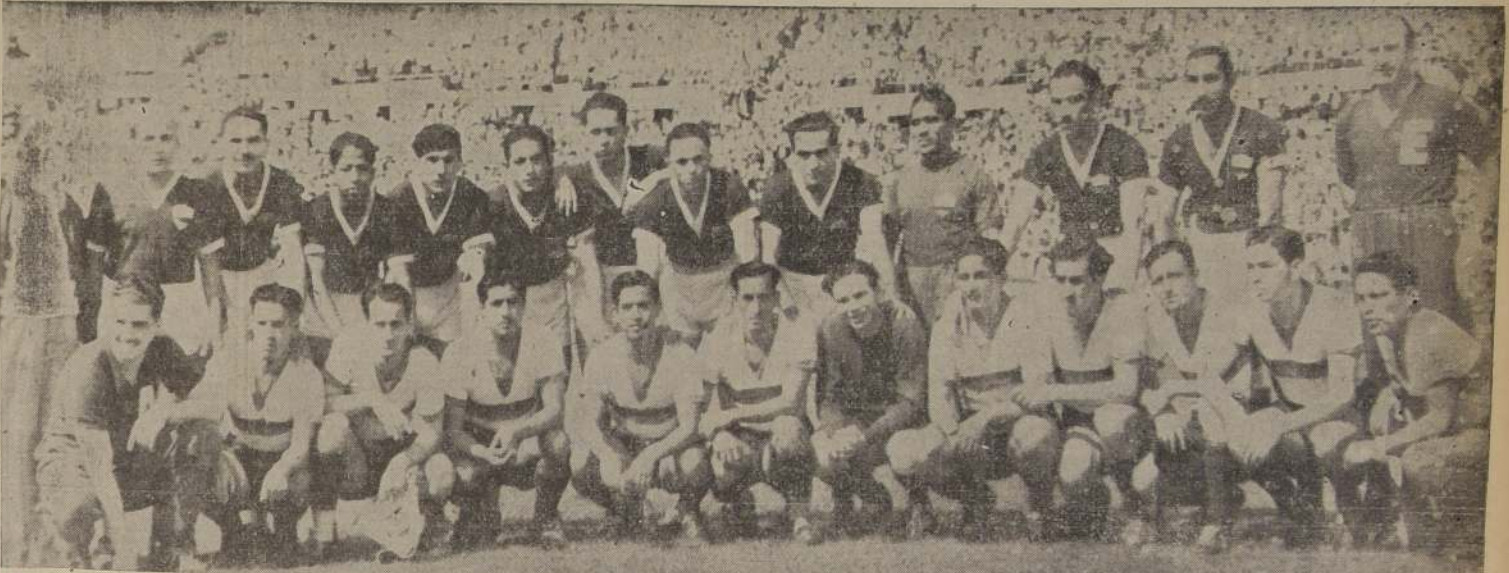
COLOMBIANOS Y ECUATORIANOS.—El triunfo de Colombia fué justo, en especial por su labor en el segundo tiempo. Así "salí de perdedores". En el grabado, en la fila de atrás están los vencedores, antes de dar comienzo al match.

Afortunadamente, el panorama varió en la etapa final. Desde el minuto se jugó con más entusiasmo, y ya enton-