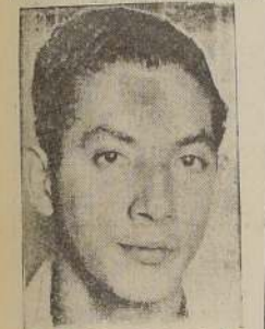
De la Hoz (Colombia)

premio, a la cual llegó sin pretensiones de ninguna especie, pero al con el ánimo de estrechar vínculos y adquirir experiencia y enseñanzas que de mucho servirán al deporte de su patria, con su asistencia por primera vez en estas internacionales, ha marcado