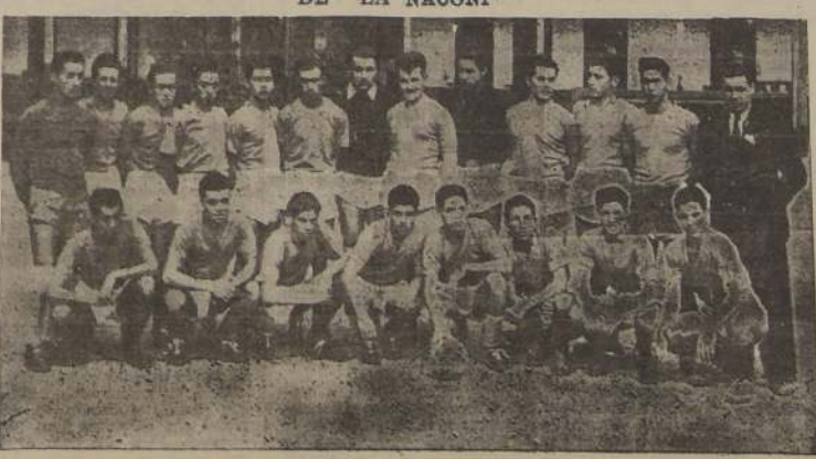
Por el tran ordinario de hoy regresarán a Concepción los juveniles penquistas de fútbol que, en viaje de estuero, permanecieron una semana en la capital, y que