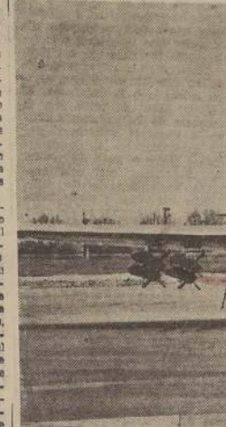
DISPARADOR DE PROYECTILES A COHETE.—En esta foto se ve el nuevo tipo de disparador de proyectiles a cohete, que se acaba de instalar en los F-80 de la Lockheed, que son los cazas a chorro adoptados como prototipo por las fuerzas armadas de los Estados Unidos.—El "F-80" carga cuatro proyectiles a cohete debajo de cada ala.

Para cooperar con la vigilancia policial, miles de militantes del Partido Unión Republicana Socialista destacaron comisiones para resguardar el orden. Las tropas permanecieron anoche y hoy acuarteladas.