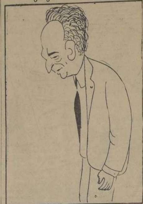
El ex Rey Leopoldo de Bélgica, cuya vuelta al trono se estima improbable, después del voto de confianza dado por el Parlamento al "Premier" Spaak.