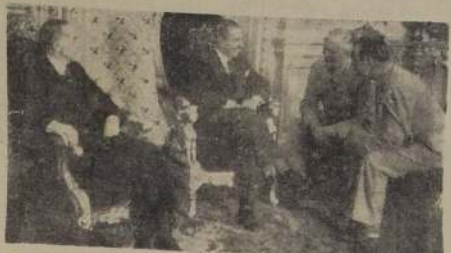
El Excmo. señor González Videla, departe cordialmente con el teniente general del Ejército norteamericano, Willis Crittenger.

El general Crittenger, y acompañados por el Excmo. señor Bowers, se dirigieron a la sede de la Embajada de Estados Unidos, para continuar su gira de cortesía por los países del Pacífico.