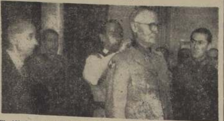
El Ministro de Defensa Nacional, general Barrios Tirado, coloca al general Crittenger, la condecoración "Al Mérito". A la izquierda, el Embajador Excmo. señor Bowers, y a la derecha, el Comandante en Jefe del Ejército, general señor Cañas Montalva.

espontáneo de los más elevados sentimientos de amistad y solidaridad continental, como también por el sentido altamente prematuro de sus gobernantes que han sabido fortalecer la paz por el desinterés, acrecentar la justicia por la práctica del derecho, y mantener la democracia en defensa de sus principios fundamentales".