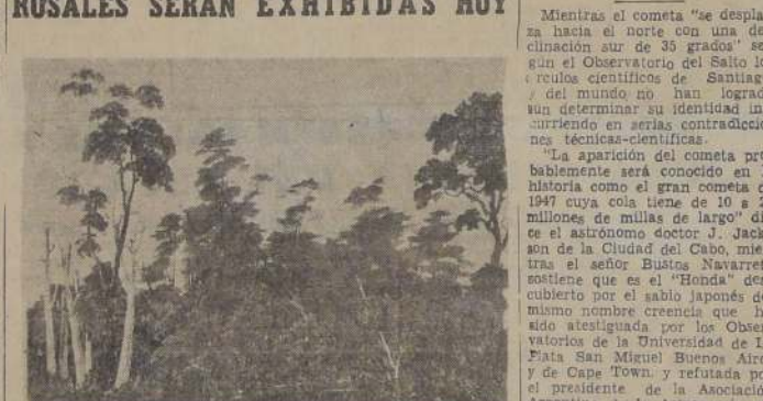
Oleo de Vicente Pérez Rosales, captado en orillas del Lago Llanquihue, en 1850.

Cuarenta y tres obras, entre dibujos y oleos, ejecutados por el eminente escritor y colonizador, don Vicente Pérez Rosales, serán exhibidas hoy en el Museo Nacional de Bellas Artes y cuya inauguración se realizará a las 18.30 horas. Estas obras datan de hace cien años y fueron captadas por el historiador Pérez Rosales durante sus viajes por el sur de Chile, más precisamente los terrenos apropiados para la colonización. Son documentos históricos más importantes del siglo pasado.