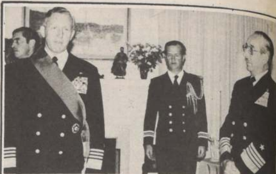
El lunes en la noche, el almirante Thomas Hayward fue condecorado por el Almirante Merino con la medalla "Presidente de la República", en el grado de "Gran Oficial".

Finalmente señaló que las monitoras de la Secretaría a lo largo del año coordinarán cada día más las tareas a realizar con CEMA Chile, adelantando que realicen las voluntarias serán a la V y VI. "Todos los años hemos viajado y en esta temporada lo seguiremos haciendo. En el mes de abril visitaremos las comunas más cercanas a la Región Metropolitana y luego a guiramos al resto del país", terminó diciendo la Secretaria Nacional de la Mujer.