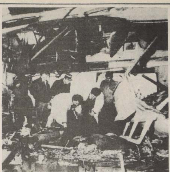
LIMOGES, Francia. — Estado en que quedó uno de los carros del "Expreso Capitol", luego de una explosión, cuando el tren iba en marcha. El atentado costó la vida a cinco personas, en tanto que otras 28 resultaron heridas.

Las tropas dispararon al aire para dispersar a los manifestantes.