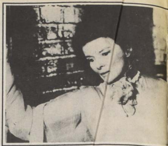
Katherine Hepburn, a los 72 años, es la primera actriz que gana cuatro Oscar de la Academia en su carrera.

tas, distinguidos universitarios y ciudadanos, trazarán sus propias sendas de superación con metas fijas, en pro de sus ideales. Cuáles son estos acicates, de donde provienen ellos, qué factores de época y en qué medida éstos son parte de algo trascendental; eso está tratado en el filme, con inteligencia, sutileza y con una seriedad poco común en un cine que busca una amplia taquilla. "Carros de fuego" puede entretener a amplios sectores de público. A quienes gustan del cine recreativo, deportivo, romántico, de época, a los que específicamente se interesan por las carreras y su mundo y también para los que