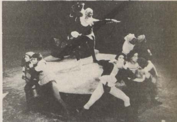
En el grabado, una escena del montaje chileno del ballet "Carmina Burana", creado por el compositor Carl Orff, quien falleció a los 86 años en una clínica de Munich, Alemania.

La obra más aclamada de Orff, "Carmina Burana", es una composición para coros, orquesta y solistas, basada en textos del siglo XIII escritos en latín vulgar.