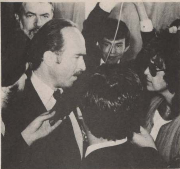
"Las relaciones entre Estados Unidos y Chile son excelentes" declaró ayer en su primera intervención pública el embajador del país del norte, James D. Theberge.

Observó que la administración Reagan reconoce claramente la importancia del desarrollo social y económico para una paz a largo plazo, progreso y estabilidad. Y es por esa razón que Estados Unidos está respaldando las reformas en El Salvador, Guatemala, Costa Rica y en otras partes. Más aún —dijo— el Presidente Reagan ha propuesto un comercio amplio, más inversiones y un plan de asistencia para Centroamérica y el Caribe.