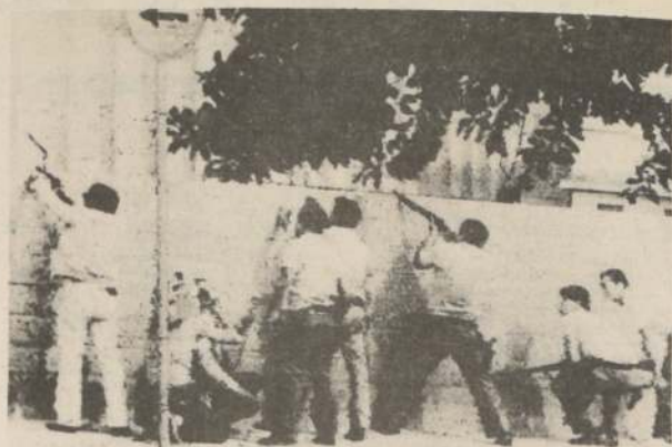
SAO PAULO, Brasil.— La policía en los momentos que dispara contra los presos que intentaron escapar de una cárcel paulista.

El factor clave que plantea la ofensiva es la cuestión de las municiones, que siempre es un factor conflictivo con los rebeldes, quienes a veces reciben unas 60 ó 70 balas para todo el día de lucha.