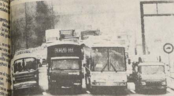
PARIS. — Camioneros y conductores de autobuses obstaculizan el tránsito en protesta por el aumento del precio de la gasolina.

Diana y Carlos se casaron en 29 de julio del año pasado en una fastuosa ceremonia celebrada en la Catedral de San Pablo de Londres.