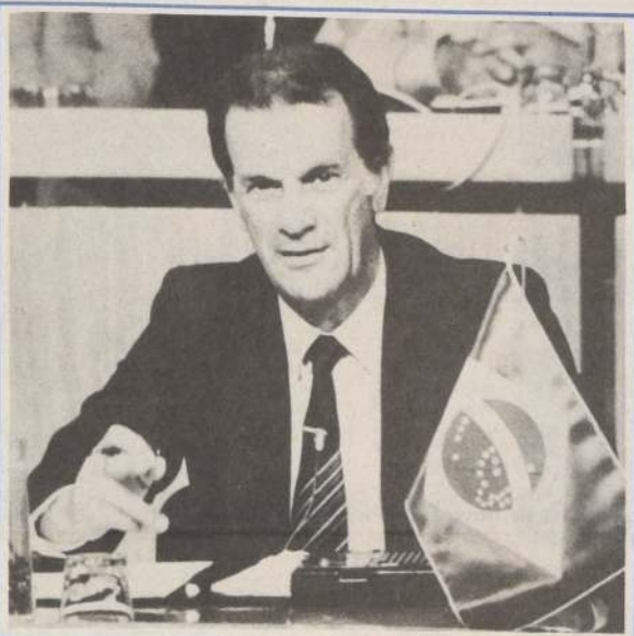
TELE SANTANA, "un Señor del fútbol". Es la base de la confianza y tranquilidad con que sus compatriotas esperan el Mundial.

En una reciente entrevista publicada por el diario "Jornal Do Brasil", Santana hizo una síntesis de su estilo de trabajo, al afirmar que "nosotros no estamos en la selección por diversión. Ni muchos menos para mostrar y convencer al mundo de que sabemos jugar. En estos momentos, el mundo está cansado de conocer la calidad del fútbol brasileño. Nuestra misión es otra: en la selección estamos para jugar y ganar".