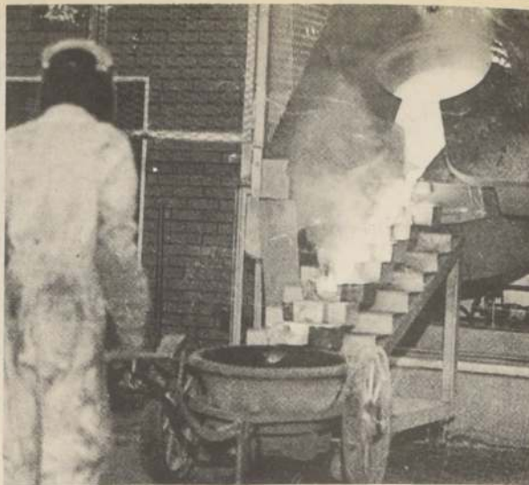
La caída que viene experimentando el precio del oro en los mercados mundiales, hace aconsejar a los expertos cambiar las inversiones de metal en "papeles de inversión".

67,17 centavos de dólar la libra. Precio promedio del mes: 68,67 centavos. Precio promedio del año: 71,29 centavos.