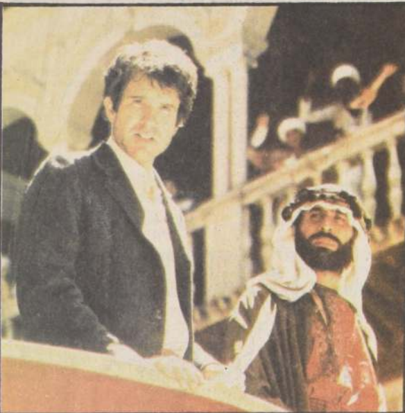
Warren Beatty obtuvo el Oscar como el Mejor Director por su trabajo en el filme "Reds", cinta que también se llevó el premio a la Mejor Actriz de Reparto, Maureen Stapleton, y a la Mejor Cinematografía.

Considerado por la crítica americana como "un poeta de la interpretación", luego de recibir el Oscar Honorario del 80, Henry Fonda, en estricta justicia, mereció la distinción al Mejor Actor 81 por su trabajo en "En la laguna dorada".