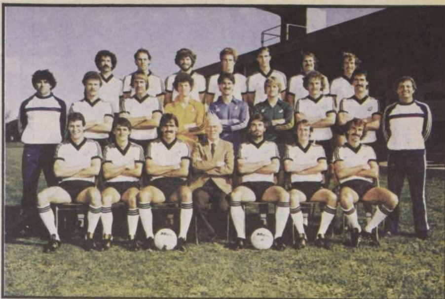
En el ambiente deportivo de Nueva Zelanda, se ha bautizado al Seleccionado que concurrirá a España como "los Kiwis", una avecita que también es símbolo nacional. Aunque debutan en una Copa del Mundo, algunos de sus jugadores juegan en Gran Bretaña, y tienen una vasta experiencia internacional.

La acusación de Martina por cargos de lesión con mala intención y aleveza contra el delantero del Fiorentina y de la Selección Italiana de Fútbol, Giancarlo Antognoni, de 27 años, se originó de un choque entre los dos jugadores durante el partido del Fiorentina contra el Génova disputado en la cancha del primero el 22 de noviembre.