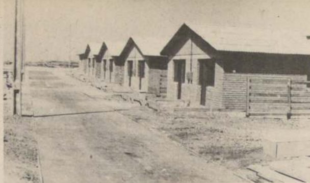
La nueva población Universo, construida con fondos del Consejo Social de Ministros.