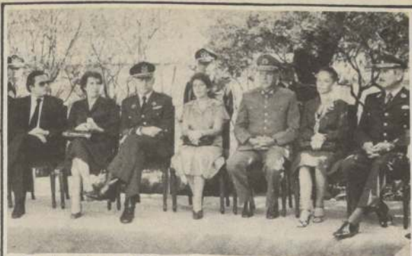
Con la asistencia del Comandante en Jefe de la Fuerza Aérea e integrante de la Junta de Gobierno, Fernando Matthei, su esposa y autoridades de la Municipalidad de Providencia, de Salud y representantes del Presidente de la República, se inauguró nueva sede de CONAPRAN.

Personal de Carabineros y de la policía civil realizaban hasta el cierre de esta edición variadas diligencias, con el fin de detener a los autores de una serie de robos perpetrados en la madrugada de ayer en diversas oficinas del aeropuerto Comodoro Arturo Merino Benítez. De acuerdo a las primeras informaciones recogidas en el principal terminal aéreo de Santiago, las oficinas afectadas son las de la línea aérea "Varig", las del personal de Aduanas y otras dependencias que no fueron especificadas. En el local de la empresa aérea brasileña, los maleantes — tras forzar una puerta — se apoderaron de una pequeña caja de seguridad, que contenía dólares y moneda nacional, por un monto total equivalente a sesenta mil pesos. En las oficinas del personal que labora en el Servicio de Aduanas, los delincuentes penetraron luego de inutilizar una cerradura, sustrayendo de una máquina calculadora y otras especies de menor valor. Oficiales de la Sección Huellas de Investigaciones efectuaron durante la mañana de ayer un completo peritaje.