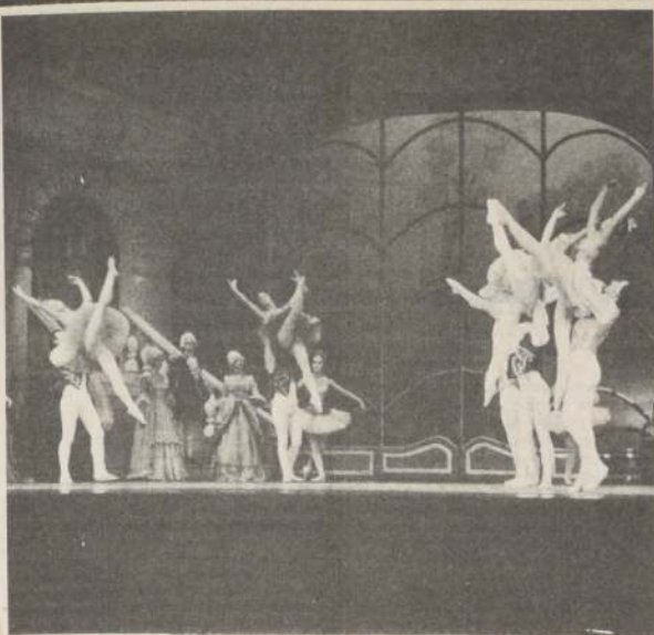
Un momento del ballet "La Bella Durmiente" en su debut del lunes recién pasado.

Hasta el momento se sabe que el artista ofrecerá dos recitales a mediados de abril, luego de sus exitosas presentaciones en algunas comunas de la capital.