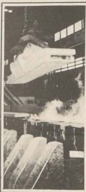
Moderna instalación en la mina Western Deep Levels de Sudáfrica, la más profunda del mundo. Los campos auríferos ocupan 480 kilómetros en Transvaal y Estado Libre de Orange en el extremo sur del continente negro. A la derecha una vista general del yacimiento.

□ Completo análisis de la situación del metal