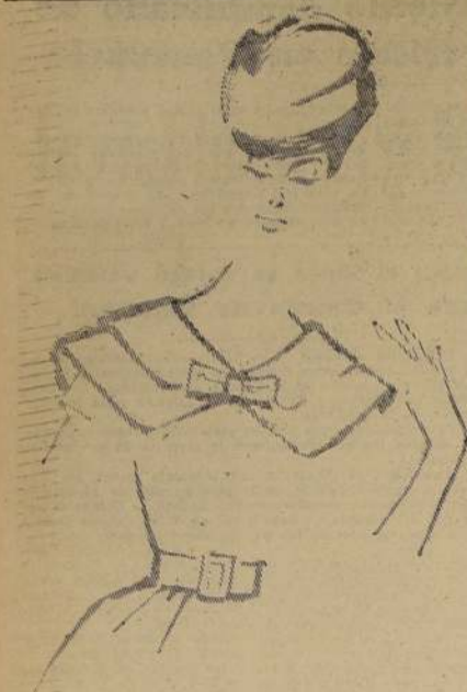
ENCANTADOR y juvenil cuello, muy apropiado para los vestidos de verano.