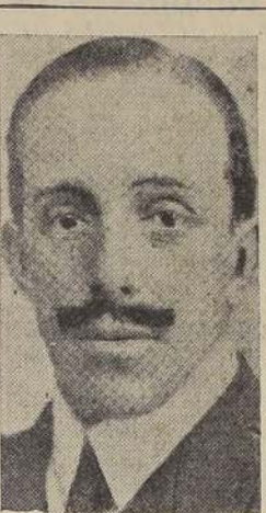
S. M. Alfonso XIII

Nos agradaría el desarme en el Pacífico; pero dudamos de la posibilidad de conseguirlo. —(U. P.)