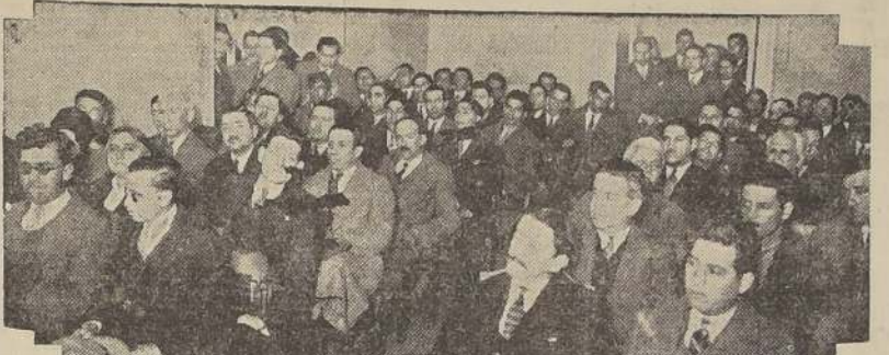
La asamblea general de delegados ante el Congreso Social Obrero de Chile, en su sesión de anteañoche, en la cual adoptó los últimos acuerdos relativos a la gran concentración popular de mañana en el Teatro Esmeralda.

Las poblaciones solidarias con la Central Obrero de Chile en vista de la actitud sediciosa de los elementos reaccionarios y desleales. En esta ocasión se confirmará la más absoluta adhesión al Primer Mandatario de la Nación.